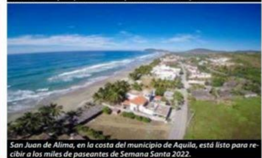
San Juan de Alima, en la costa del municipio de Aquila, está listo para recibir a los miles de paseantes de Semana Santa 2022.