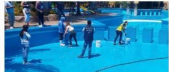
Personal de la Coepris encontró en la región cinco albercas fuera de la norma, o no aptas para el sano esparcimiento de las personas.

El Comisionado Estatal, Hebert Flores Leal, al indicar que dichas acciones forman parte ➔ 6