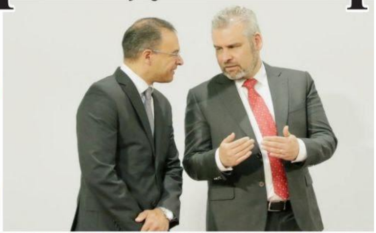
MORELIA, MICH.- En conferencia de prensa, Ramírez Bedolla puntualizó que queda sin efecto la deuda y contrato con la empresa SPE Michoacán Seguro S.A. de C.V.