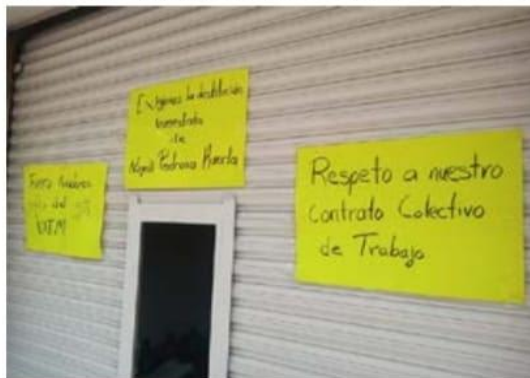
Trabajadores del plantel Icatmi de LC, a través de pancartas hace ver la inconformidad que tienen con la institución.