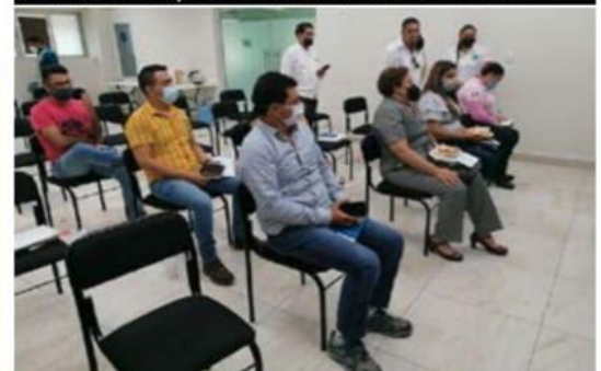
Asistentes al foro de AA celebrado ayer en esta ciudad.