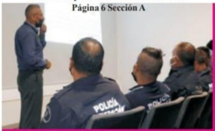
Página 6 Sección A

SSP continúa el proceso de convocatoria de Ascensos y Condecoraciones 2022