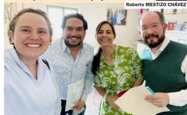
MORELIA, MICH.- Representantes de la Fundación Javier Marín, de la SCOP, y de la Secretaría de Cultura del gobierno del estado, así como del gobierno del municipio de Uruapan, se reunieron ayer para establecer las acciones que impulsen la ejecución del proyecto Centro Cultural Fábrica de San Pedro, en la ciudad de Uruapan.