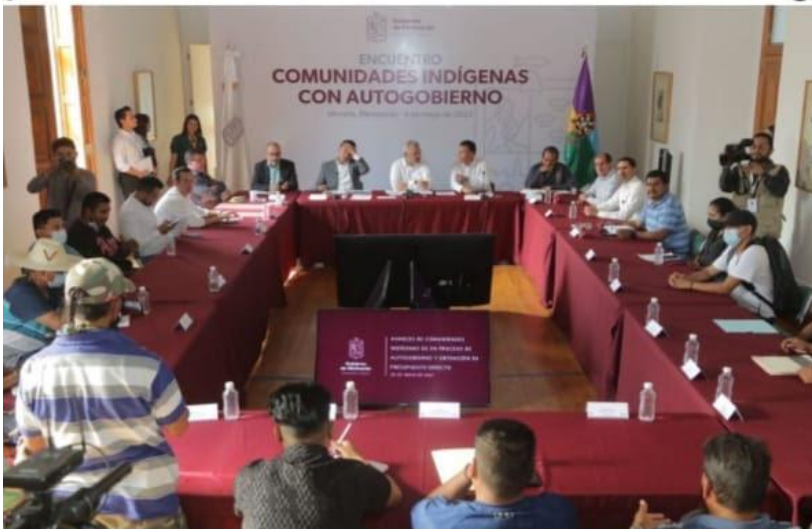
MORELIA, MICH.- Nuestro gobierno es promotor del derecho al autogobierno y de que las comunidades indígenas accedan al presupuesto directo, destacó el gobernador Alfredo Ramírez Bedolla.