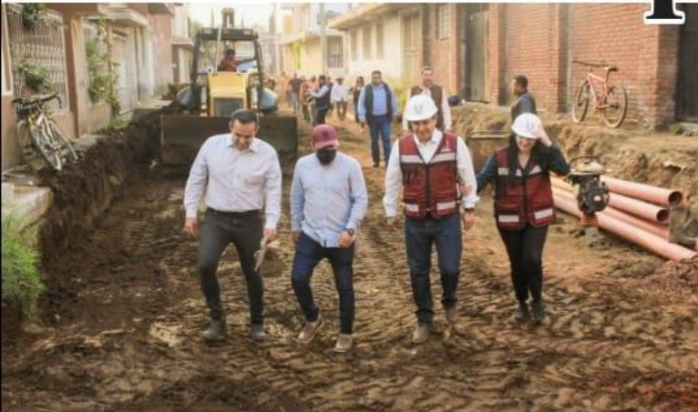
URUAPAN, MICH.- Al continuar con la ejecución del Programa de Obras Públicas de este año, el alcalde, Ignacio Campos Equihua, dio ayer el banderazo de arranque a tres trabajos de pavimentación, en los que la inversión es superior a los 12.2 millones de pesos.

■ Son asentamientos que desde hace muchos años carecen de la adecuada infraestructura urbana