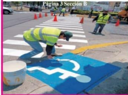
Página 3 Sección B

SEDUM brinda apoyo de balizamiento en cruces peatonales