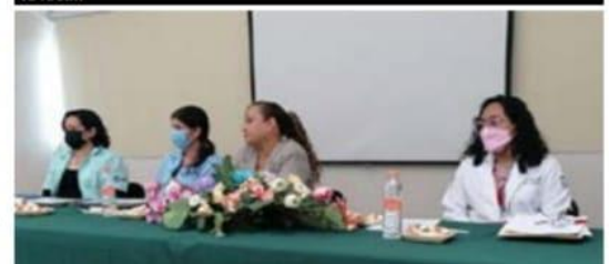
Las cuatro ponentes que participaron ayer en el foro de AA celebrado en la sala de usos múltiples de la clínica del IMSS 78 de esta ciudad.