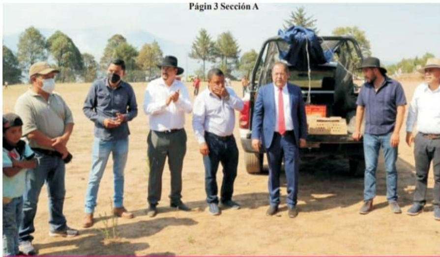
Página 3 Sección A

SEDUM brinda apoyo de balizamiento en cruces peatonales