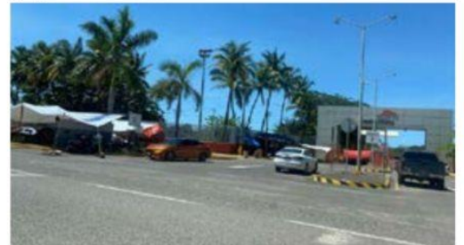
Mineros de la 271 dijeron no espantarse con sus presuntas liquidaciones o terminación de su CCT, ellos siguen firmes con su paro o huelga de hechos, apostados en los "piquetes de vigilancia".