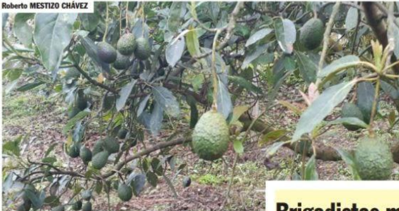
URUAPAN, MICH.- Debido a la sequía y a las altas temperaturas registradas, se podría perder hasta el veinticinco por ciento de la cosecha de aguacate durante la presente temporada.