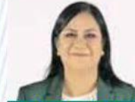
Ariadna Montiel Reyes Secretaría de Bienestar