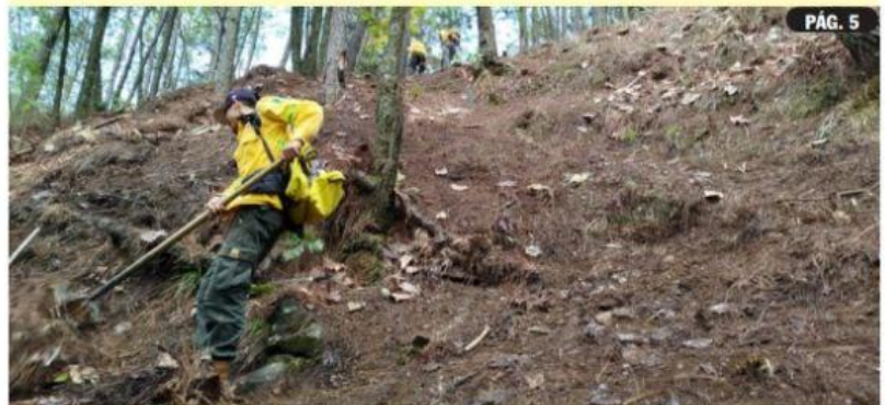
URUAPAN, MICH.- Brigadistas municipales de Fénix y Delfines realizan labores en el cerro de La Charanda con el fin de proteger y conservar las áreas boscosas.