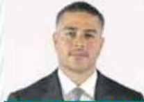
Omar García Harfuch Secretaría de Seguridad y Protección Ciudadana

Tras la revelación de estos nuevos cargos, restan cinco nombramientos. / Pág.08