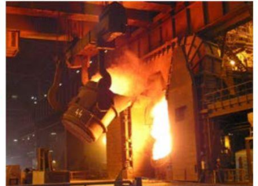
ArcelorMittal a la espera de la decisión de un tribunal, respectivo a la terminación del CCT con el sindicato minero, de sus más de 3,500 obreros que pertenecen a la sección 271.