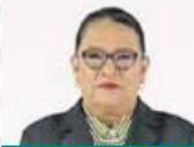
Rosa Icela Rodríguez Secretaría de Gobernación