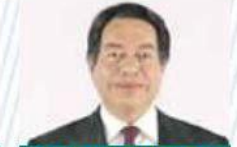
Mario Delgado Carrillo Secretaría de Educación Pública