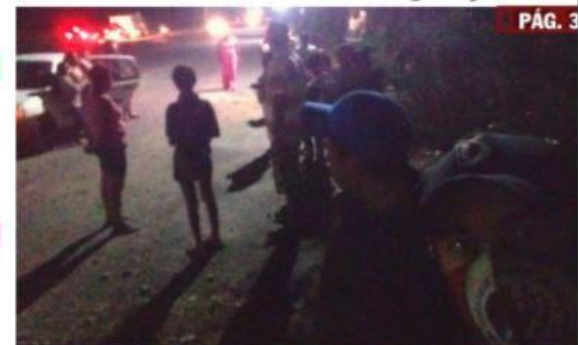
CD. LÁZARO CÁRDENAS, MICH.- Habitantes del fraccionamiento Puerto Nuevo de la tenencia de Buenos Aires, protestaron la noche del lunes por las pocas horas que su colonia recibe agua potable, además de la poca presión que es insuficiente para llenar los tinacos de sus hogares.