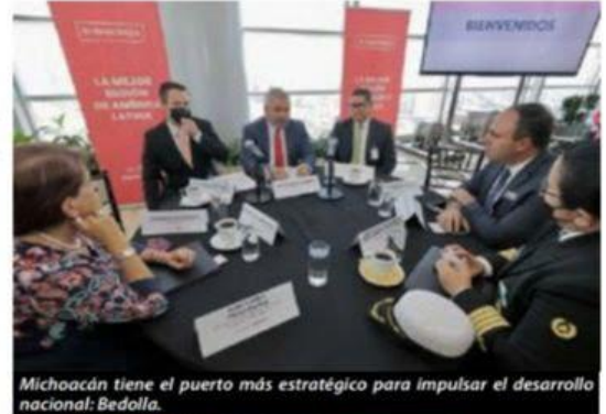
Michoacán tiene el puerto más estratégico para impulsar el desarrollo nacional: Bedolla.

Asociación Mexicana de Agentes Navieros, de Grupo Traxión y Empresas Globales, el mandatario expuso las ventajas competitivas que ofrece el Puerto de » 4