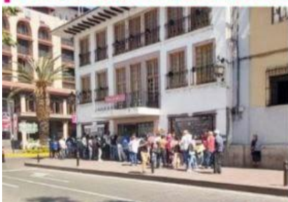
URUAPAN, MICH.- Contribuyentes, personas físicas, se quejan de la falta de personal y la lentitud con que se reciben las declaraciones fiscales en las oficinas del SAT, que lucen saturadas.

Se satura el servicio en el SAT por la presentación de declaraciones fiscales