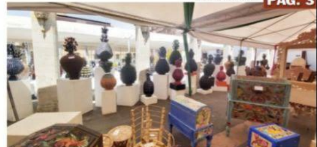
URUAPAN, MICH.- Al concluir las inscripciones para participar en el LXI Concurso Estatal de Artesanías, se informó que se registraron 2,560 piezas de 1,420 artesanos, procedentes de 80 comunidades de 36 municipios, que se disputan una bolsa de un millón 200 mil pesos en 297 premios.