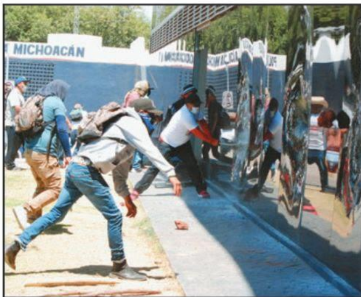
COMUNEROS DE ARANTEPACUA, CON PALOS, PIEDRAS, PINTURA EN AEROSOL Y COHETONES, ATACARON LAS INSTALACIONES DE LA FISCALÍA ESTATAL, AL IGUAL QUE EN LA SEDE DE LA SSP Y EL PALACIO DE GOBIERNO.