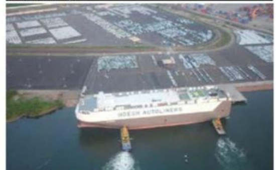
Grupo SSA México destacó la cifra récord que manejó en este puerto la Terminal Especializada de Autos (TEA).