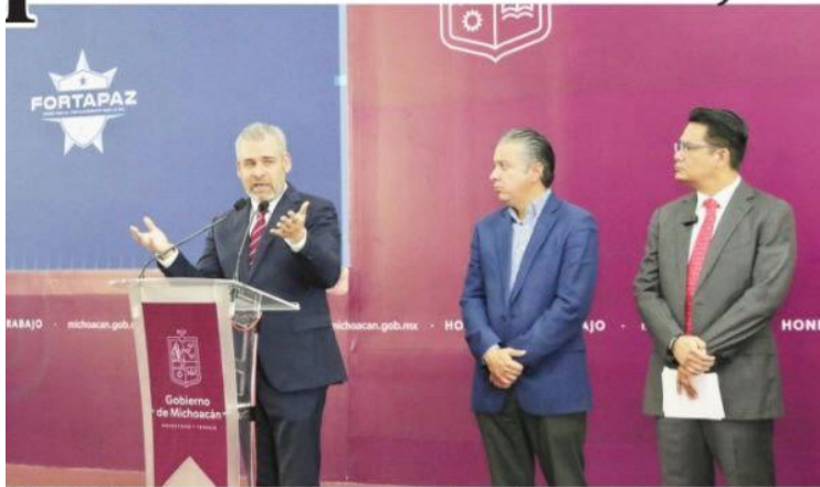
MORELIA, MICH.- El gobernador del estado, Alfredo Ramírez Bedolla, recalcó que para su gobierno la seguridad pública es una prioridad y por ello se han tenido importantes avances en el combate a los índices delictivos.

■ A pesar de fosas clandestinas en Uruapan, índice de homicidios dolosos ha disminuido, asegura