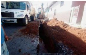
RUAPAN, MICH.- Ahora la Capasu atiende de inmediato los reportes hechos por sus usuarios respecto a fallas en sus servicios o redes en mal estado, por lo que las quejas por falta de atención han disminuido en un 85%.

Secretaría de Turismo canalizará en 2023 recursos a Uruapan y San Juan Nuevo