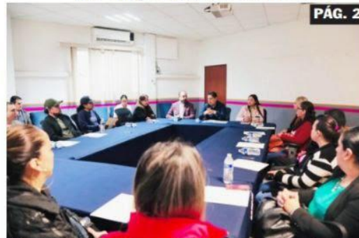
URUAPAN, MICH.- El presidente municipal impulsa con hechos a los emprendedores, por lo que ayer entregó a catorce de ellos recursos del programa Impulsamich.