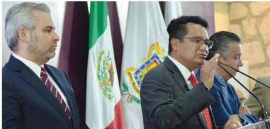
Fortapaz. El secretario ejecutivo del Sistema Estatal de Seguridad Pública, César Erwin Sánchez, y el gobernador, Alfredo Ramírez Bedolla, dieron a conocer que se ahorraron 14.4 millones de pesos del Fortapaz este año, con lo que se beneficiará a casi 3 mil 700 uniformados.

Propuesta. En el presupuesto de egresos 2023 que se envió al Congreso local se contempla un monto de 60 millones de pesos para que los elementos de la Guardia Civil también cuenten con seguro de vida. / Pág. 02