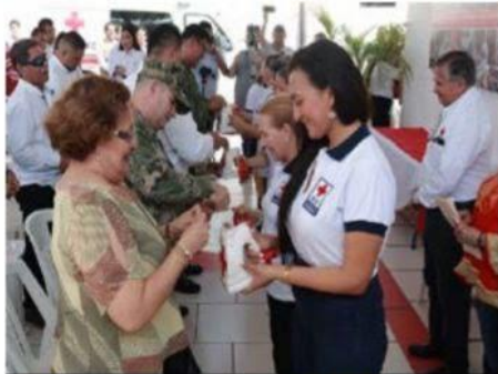
En un evento realizado en las instalaciones de la Cruz Roja local, se puso en marcha ayer la Colecta 2022 de la benemérita institución.

El voluntariado es importante y muy necesario para la transformación social, económica y cultural, coincidieron presidente y vicepresidenta del Consejo de la Cruz Roja, Delega >>> 2