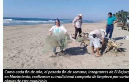
Como cada fin de año, el pasado fin de semana, integrantes de El Bejuco en Movimiento, realizaron su tradicional campaña de limpieza por varias playas de este municipio.