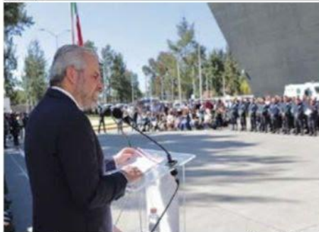
El gobernador entregó reconocimientos y ascensos a policías de la Guardia Civil.

ello, tras los resultados del pasado domingo en otra mega campaña >>> 4