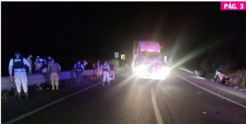
CD. LÁZARO CÁRDENAS, MICH.- La Guardia Nacional y el Ejército Mexicano resguardan la mercancía tras un accidente en la autopista Siglo XXI. Transportistas y autoridades coordinan esfuerzos para reducir la incidencia de robos en esta importante vía de tránsito.

► Ya se ven resultados, aseguran transportistas PÁG. 3