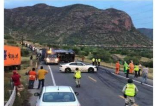
Así se observó por varias horas ayer la "autopista de la muerte" en el tramo Las Cañas-Cuatro Caminos, por un choque de frente entre dos tráileres.

XXI. Ello cuando se le preguntó al secretario general del Sindicato de Trabajadores de las Líneas del Transporte de la República Mexicana, CROC Sección 91, si han presentado como parte del sector transporte » 6