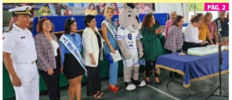
CD. LÁZARO CÁRDENAS, MICH.- El Instituto Michoacano de Ciencias de la Educación está celebrando su trigésimo cuarto aniversario de formar profesionales en la educación.