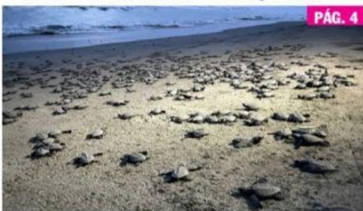
CD. LÁZARO CÁRDENAS, MICH.- El Habillal, a sólo 15 minutos de Playa Azul, invita a disfrutar este fin de semana del Tortufest.

► Llega la segunda edición del Tortufest, a tan sólo 15 minutos de Playa Azul