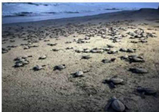
Llega la segunda edición del Tortufest, a tan sólo 15 minutos de Playa Azul.

En la comunidad El Habillal, ubicada a tan sólo 15 minutos de Playa Azul, en el municipio de Lázaro Cárdenas, sus habitantes realizarán los días 8 y 9 de diciem- » 2