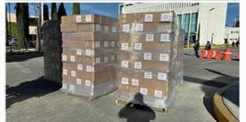
La acerera realizó donativo de 2 mdp para apoyar a estudiantes afectados, además de 3 mil despensas para familias afectadas.