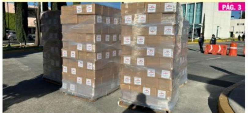
CD. LÁZARO CÁRDENAS, MICH.- A 105 días del paso del huracán Otis, la siderúrgica ArcelorMittal México donó 3 mil despensas, 2 millones de pesos en becas y viveres donados por los colaboradores.