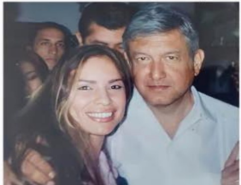
La Secretaria de Mexicanos y Mexicanos en el Extranjero del CEN de Moreno, manifestó su total respaldo al paquete de iniciativas de reforma, enviadas recientemente por el presidente AMLO.

Las iniciativas de Ley que presentó el Presidente de México, Andrés Manuel López Obrador, en el marco de la conmemoración de la Constitución Política de México, permitirán reformar la constitución para» 8