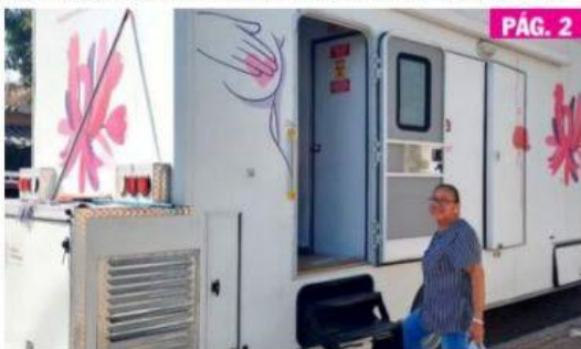
CD. LÁZARO CÁRDENAS, MICH.- Se invita a las mujeres de 49 a 69 años a aprovechar la unidad móvil de mastografía, que estará en este municipio hasta el 25 de marzo.