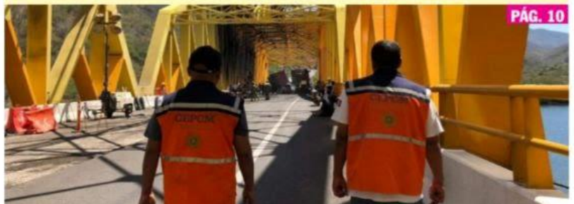
INFIERNILLO, MICH.- Personal de Protección Civil Michoacán determinó que la estructura del puente no sufrió daños.