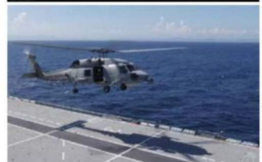
Instantes después de despegar de la plataforma de un buque, a 200 millas náuticas al sureste del litoral de LC, un helicóptero de la armada se desplomó en el mar, muriendo 3 de sus 8 tripulantes, dos de ellos están desaparecidos.