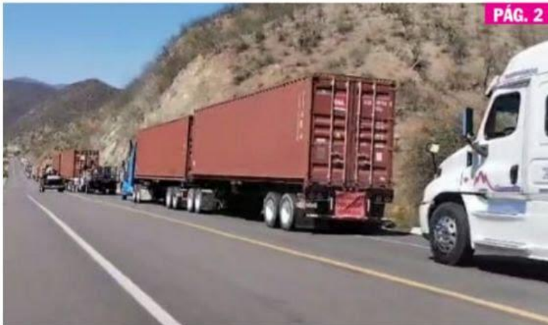
CD. LÁZARO CÁRDENAS, MICH.- Largas filas de transportistas de carga se apreciaron ayer, por el cierre de la autopista Siglo XXI.

► Será un desafío logístico mover tal cantidad de unidades rezagadas, reconoce la Atlac