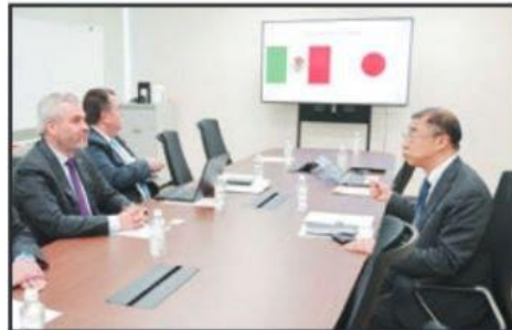
EL GOBERNADOR ALFREDO RAMÍREZ SE REUNIÓ CON INVERSIONISTAS DE JAPÓN, EN EL MARCO DE LA FOODEX 2024.