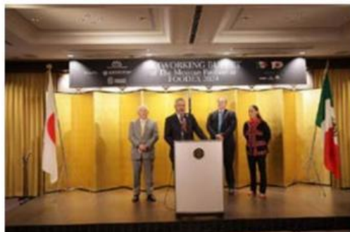
Gobierno del estado y embajada de Japón en México, trabajarán agenda conjunta para atraer inversión nipona a Michoacán.

Tokio, Japón, 6 de marzo de 2024.- El gobierno de Michoacán y la Embajada de México en Japón trabajarán una agenda conjunta para incentivar la instalación de empresas asiáticas en la entidad y aprovechar productos agropecuarios para la exportación. Tras exponerse que a los japoneses les interesan las energías limpias para el desarrollo y la expansión de sus servicios en el sector automotriz, electro- >> 2