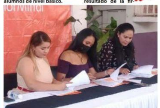
La SEE y el Centro Cultural ArcelorMittal, suscribieron ayer un convenio de colaboración para impulsar la cultura de la paz a través de las artes.