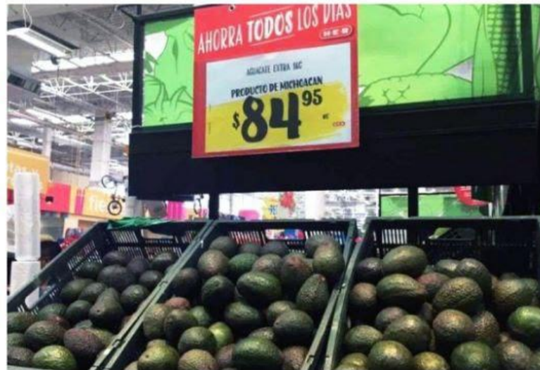
URUAPAN, MICH.- El aguacate michoacano sigue rompiendo sus propias marcas y actualmente se cotiza en cerca de cien pesos el kilogramo, estimándose que su precio seguirá al alza en las siguientes semanas.