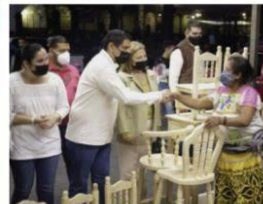
URUAPAN, MICH.- El alcalde, Nacho Campos, acudió al centro de la ciudad a dar personalmente la bienvenida a los artesanos que participarán en el Tianguis de Artesanías; el edil, cabe señalar, está entre los mejores posicionados del país, de acuerdo a MassiveCaller.