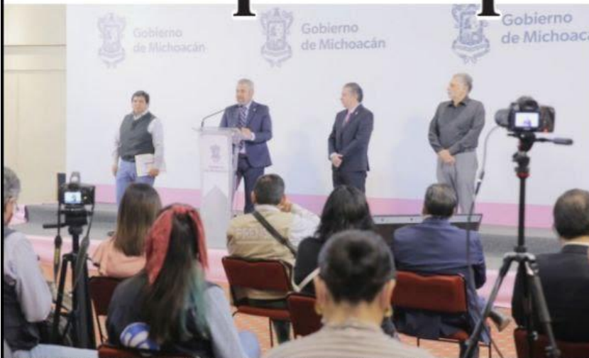
MORELIA, MICH.- El gobernador Alfredo Ramírez Bedolla, destacó la conclusión de obras en 63 municipios del estado.