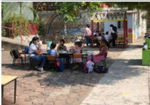
Ante el riesgo que representa el edificio de su escuela, niños de preescolar del segundo sector del Fidelac, toman clases en la vía pública.

En el propósito común de promover la paz desde la enseñanza, para la Secretaría de Educación en el Estado (SEE) y el Centro Cultural ArcelorMittal, utilizarán las herramientas tecnológicas para llevar el arte a alumnos de nivel básico. Las acciones se reforzarán desde ahora como resultado de la fir- >>> 4