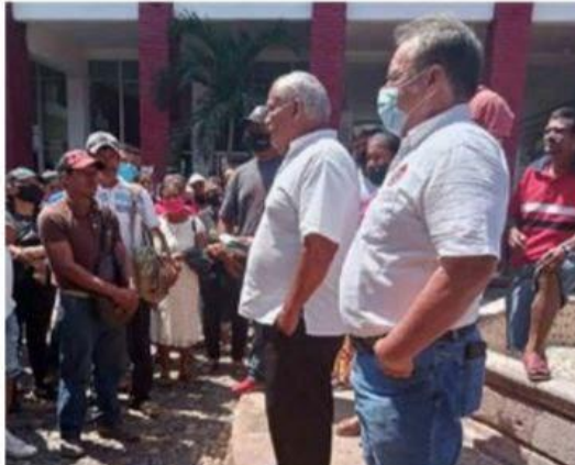
Luego de realizar una manifestación en el patio central de palacio municipal, acompañados de dirigentes cetemistas, los pepeñadores del relleno sanitario lograron ser escuchados por la alcaldesa.

Pepeñadores del relleno sanitario o tiradero municipal de este lugar, se manifestaron la mañana de ayer miércoles en el pa- >>> 4