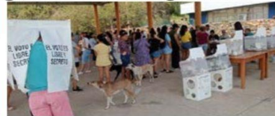
Al obtener un triunfo abrumador en las elecciones del pasado domingo, Morena y sus aliados PT y PVEM tendrá mayoría calificada en la 76 Legislatura de Michoacán.

Patrón, hoy no le voy a hablar de lo que a muchos les gusta o les disgusta, porque se que algunos comentarios que aquí escribo, no le caen nada bien, sobre todo a los adoradores de YSQ, y pos ni » 9