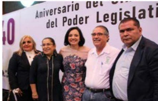
La diputada Adriana Hernández Íñiguez, reconoció a las y los agremiados al STASPLE, pues aseguró que el funcionamiento del Congreso del Estado se debe gracias a su labor.

Poder Legislativo (STASPLE), la diputada Adriana Hernández Íñiguez, reconoció a las y los agremiados » 8