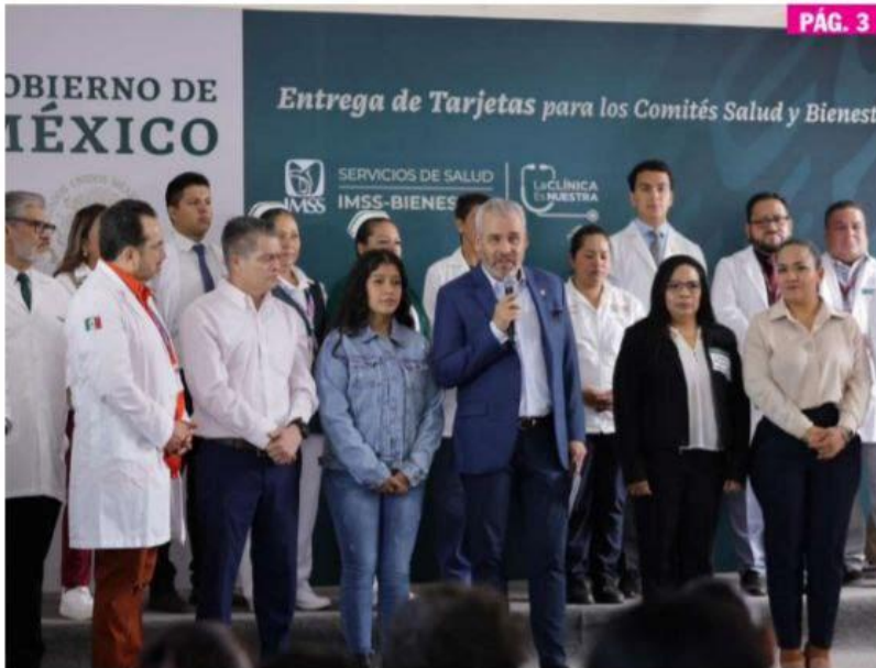
MORELIA, MICH.- El gobernador Alfredo Ramírez Bedolla, encabezó la entrega de tarjetas para los Comités de Salud y Bienestar, como parte del programa "La Clínica es Nuestra".

► El gobernador Alfredo Ramírez encabezó la entrega de tarjetas para los Comités de Salud y Bienestar