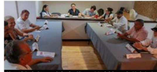
Al concluir el cómputo de la elección municipal del pasado 02 de junio, este viernes el Consejo local del IEM hará entrega de las constancias de mayoría tanto a la planilla ganadora, como a los 5 regidores plurinominales.