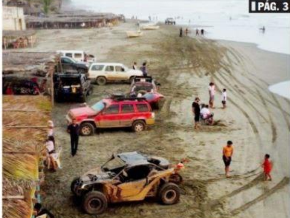
CD. LÁZARO CÁRDENAS, MICH.- Personal de campamentos tortugueros pide a los participantes del Tumbiscaletazo ser conscientes en sus futuros recorridos, ya que a su paso afectaron nidos de tortuga marina en las playas locales.

El paso de los vehículos 4X4 dañó algunos nidos, además de que se dejó mucha basura en las playas