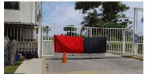
El CEN minero afirmó que es PEMEX quien se niega a encontrar una solución a la huelga de Fertinal.