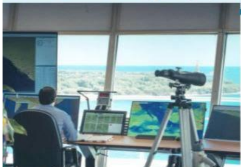
LÁZARO CÁRDENAS, MICH.- La innovación en el apoyo al fido de embarcaciones de toda clase, caracteriza al Puerto de Lázaro Cárdenas.

Puerto de Lázaro Cárdenas, a la vanguardia en herramientas y equipo para navegación