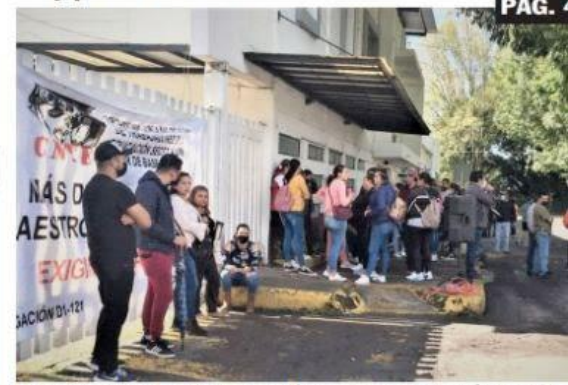
URUAPAN, MICH.- Maestros se manifestaron ante las alcaldías de Michoacán.

Hermetismo por desaparición de la Cruz Roja en Apatzingán