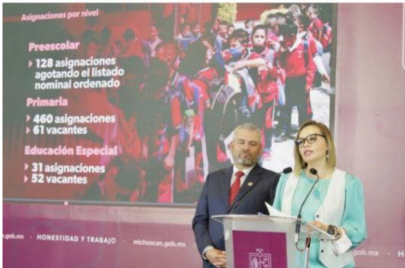
RELIA, MICH.- El gobernador Alfredo Ramírez, enfatizó que aunque la SEE esté tomada, "no se caerá en invocaciones y continuaremos trabajando por la educación integral de las y los niños".

Se trata del 25% del personal que por manifestación de grupos sindicales no cobraron a tiempo