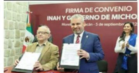
Reconoce INAH esfuerzos para la reconciliación y reconocimiento de pueblos originarios.