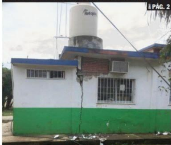
CD. LAZARO CÁRDENAS, MICH.- A tres semanas del sismo del pasado 19 de septiembre, en la región costera se tienen reportadas 55 escuelas con daños en su infraestructura.