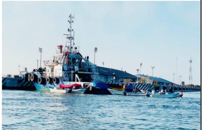
CD. LÁZARO CÁRDENAS, MICH.- Pescadores de Lázaro Cárdenas realizaron un bloqueo al interior del recinto portuario, como medida de presión para el cumplimiento de demandas; el bloqueo se levantó por la tarde, tras una reunión con autoridades.