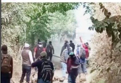
URUAPAN, MICH.- De nueva cuenta, gente de Poder de Base se enfrentó a elementos de la Policía Michoacán y de la Guardia Nacional, cuando estos evitaron que los primeros bloquearan las vías del tren, en las inmediaciones de Caltzontzin y La Cofradía.