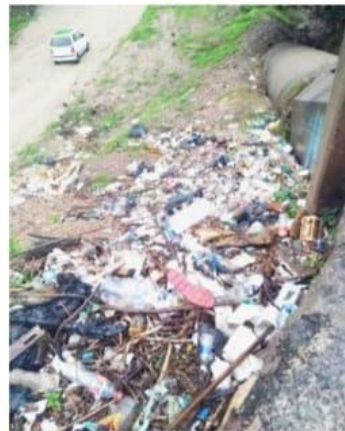
CD. LÁZARO CÁRDENAS, MICH.- La basura que es arrojada en canales pluviales, de riego o del desagüe y va a terminar contaminando los humedales, en especial el denominado sitio Ramsar.