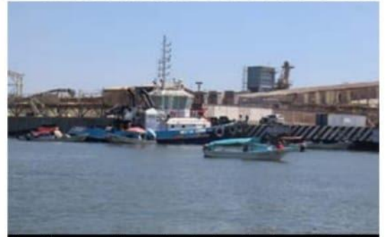
Tras el bloqueo por 10 horas al área donde se ubican los remolcadores, los miembros de la Federación de Pescadores Ribereños "Lázaro Cárdenas" obtuvieron solución parcial a sus demandas.

Ayer el CIS dio a conocer que los nuevos casos de COVID-19 tanto en este municipio como en toda la entidad estuvieron a la baja en comparación con los días recientes.