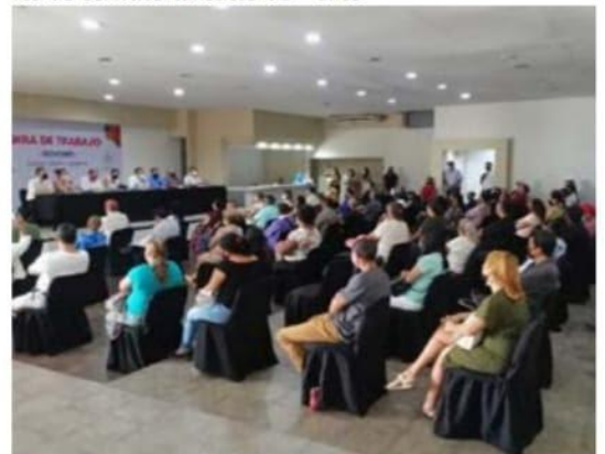
Enramaderos y demás prestadores de servicios turísticos de este municipio, confían en que ahora sí serán atendidas sus demandas por parte de la actual administración estatal.

este municipio, presentaron un proyecto sobre las necesidades básicas que encaran desde hace muchos años.