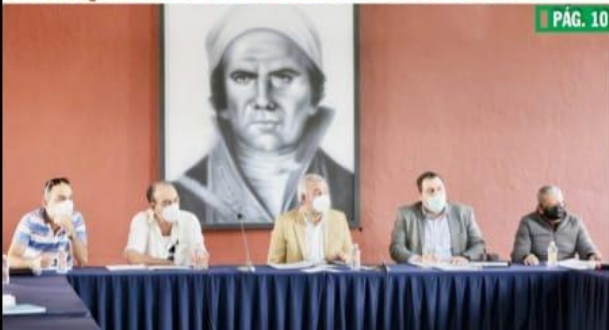
COALCOMÁN, MICH.- El proyecto integral de prevención, control y combate de incendios forestales presentado al gobernador Alfredo Ramírez Bedolla, prevé una inversión de seis millones y medio de pesos.