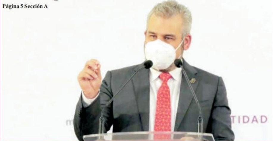
Página 5 Sección A