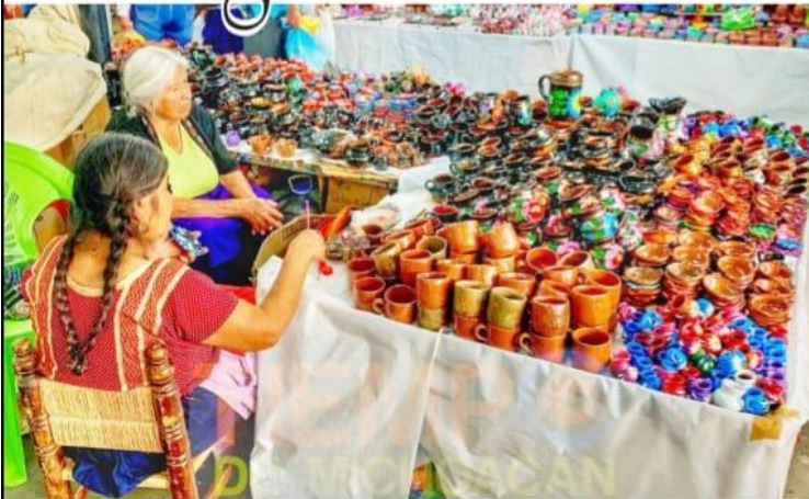
URUAPAN, MICH.- Ante la creciente cantidad de nuevos contagios diarios de Covid-19, autoridades, artesanos y prestadores de servicios turísticos buscan la mejor opción para no suspender por tercer año consecutivo el Tianguis de Artesanías del Domingo de Ramos en Uruapan.