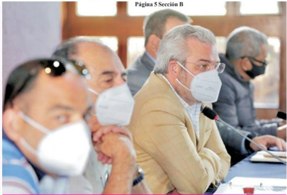
Página 5 Sección B