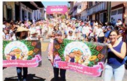
URUAPAN, MICH.- Luego de dos años de no verse, este 9 de abril nuevamente uruapenses y los mejores artesanos del estado estarán juntos, en el Desfile de Artesanos con el que arrancará oficialmente el Tianguis de Artesanías del Domingo de Ramos en Uruapan.

Artesanos de 42 comunidades, en el desfile con el que iniciará el Tianguis Artesanal de Domingo de Ramos PÁG. 4