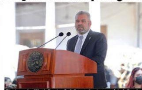
El gobernador Alfredo Ramírez Bedolla, encabezó ayer en Ario de Rosales, el 207 aniversario de la instalación del primer Supremo Tribunal de Justicia de la Nación.