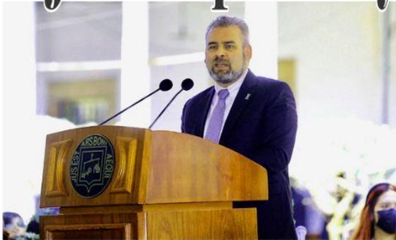
ARIO DE ROSALES, MICH.- El gobernador, Alfredo Ramirez Bedolla, presidió el 207 aniversario de la instalación del primer Supremo Tribunal de Justicia de la Nación.

Esta lucha debe incluir a los sectores desprotegidos PÁG. 10