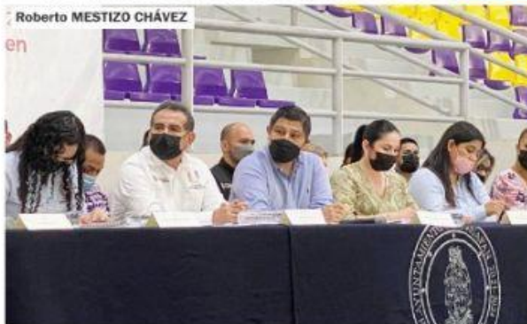
URUAPAN, MICH.- Una excelente armonía entre el alcalde, Ignacio Campos, y el CDM, permitió este lunes priorizar las primeras 17 obras públicas importantes que se ejecutarán este año.

■ Destaca la primera etapa de rehabilitación del alumbrado público en el primer cuadro PÁG. 3