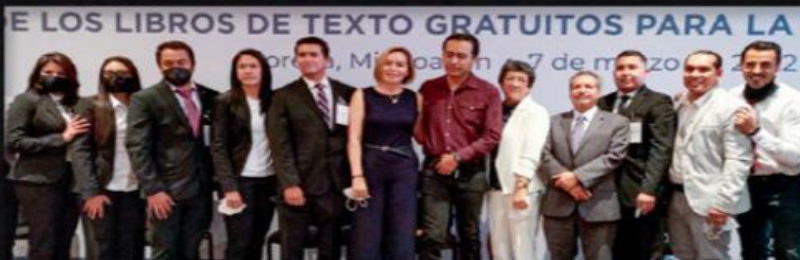
LOS LIBROS DE TEXTO GRATUITOS PARA LA URUAPAN, MICH. 7 de marzo de 2022

Maestros participan en asamblea para libros de texto y plan de estudios