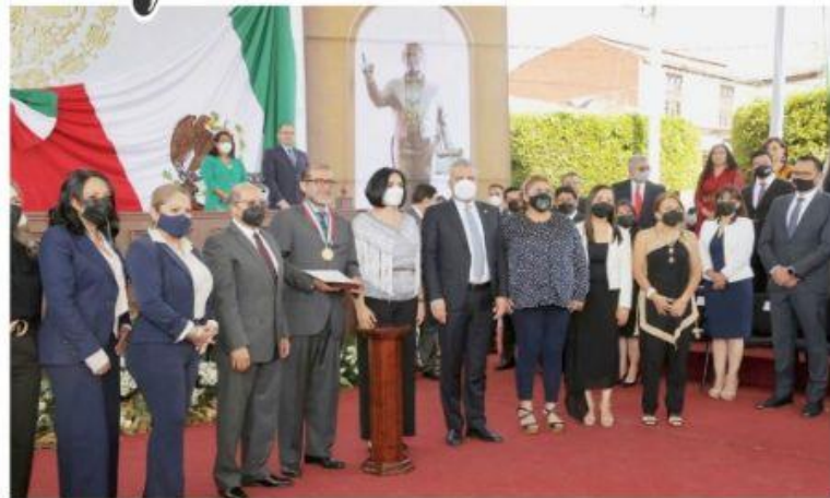
ARIO DE ROSALES, MICH.- Gobernador Alfredo Ramírez Bedolla, encabezó el acto por el 207 aniversario de la instalación del primer Supremo Tribunal de Justicia de la Nación.