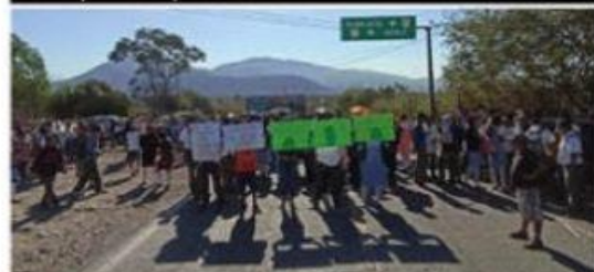
Se manifiesta la Comunidad Indígena de Ostula en la carretera costera de Michoacán.

Ayer, según el CIS en el municipio de LC solamente se documentó un nuevo caso positivo de COVID-19 para llegar a una acumulado de 16,691 en todo lo que va de la pandemia.