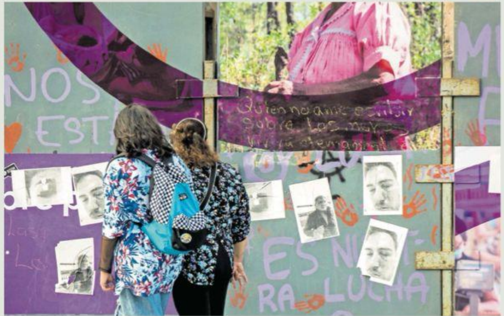
Hoy se esperan cuatro marchas en Morelia, el ayuntamiento prepara operativo y los negocios fueron tapiados

fueron asesinadas; los cuerpos de siete de ellas fueron encontrados tirados en predios baldíos a la orilla de la ciudad, otras tres fueron ejecutadas dentro de domicilios privados, mientras que dos más fueron asesinadas a balazos, una de ellas al transitar en un motocicleta y otra más dentro de un vehículo. Págs. 4, 5, 6 y 7