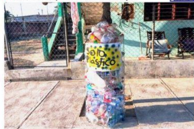
CD. LÁZARO CÁRDENAS, MICH.- La denominada "Ruta del reciclaje" en la tenencia de El Habillal va avanzando con gran éxito.

Avanza ruta del reciclaje, en El Habillal Recolectados, más de 600 kilos de pet PÁG. 2