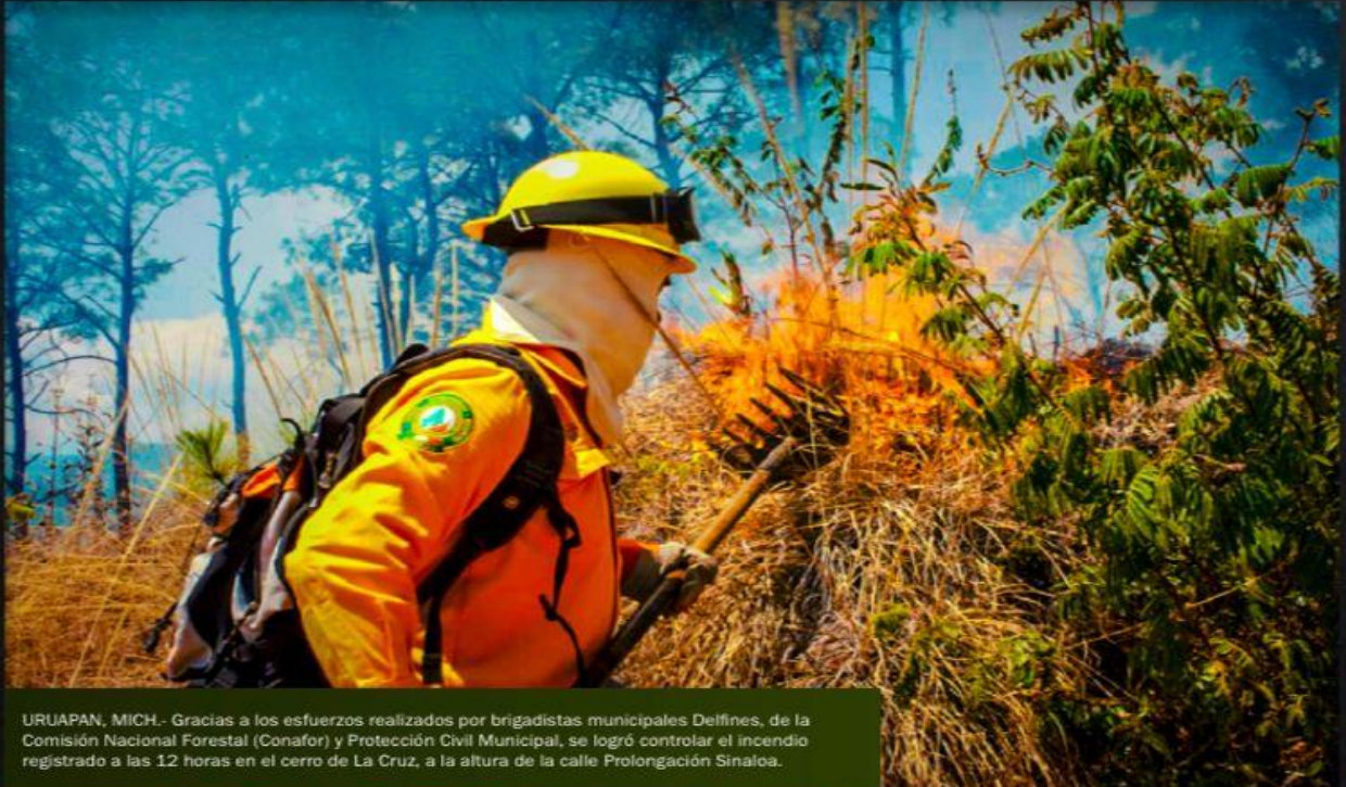
URUAPAN, MICH. - Gracias a los esfuerzos realizados por brigadistas municipales Delfines, de la Comisión Nacional Forestal (Conafor) y Protección Civil Municipal, se logró controlar el incendio registrado a las 12 horas en el cerro de La Cruz, a la altura de la calle Prolongación Sinaloa.