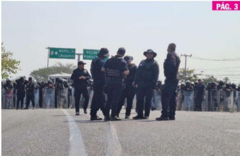
CD. LÁZARO CÁRDENAS, MICH.- Los profesores de la CNTE vieron frustrados sus planes de bloqueo al Puerto de Lázaro Cárdenas por parte de las fuerzas del orden Federal y Estatal.

► Al menos 600 elementos de Guardia Civil impidieron el paso a maestros