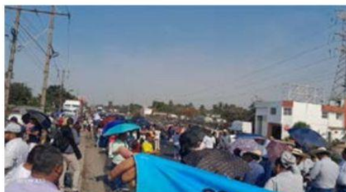
Maestros adheridos a la CNTE de todo el estado, acudieron ayer a LC para realizar una marcha y exigir el cumplimiento de sus demandas.