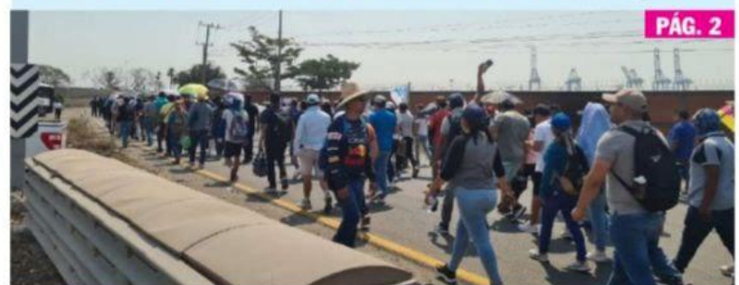
CD. LÁZARO CÁRDENAS, MICH.- Luego de que fuera bloqueado el acceso al Puerto para impedir su ingreso, profesores adheridos a la Sección XVIII CNTE protestaron con una marcha.