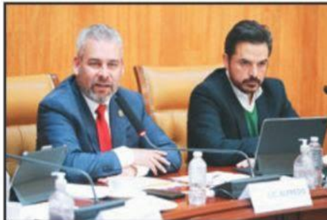
EL GOBERNADOR DE MICHOACÁN, ALFREDO RAMÍREZ BEDOLLA, SE REUNIÓ EN LA CDMX CON EL DIRECTOR GENERAL DEL IMSS, ZOÉ ROBLEDO.