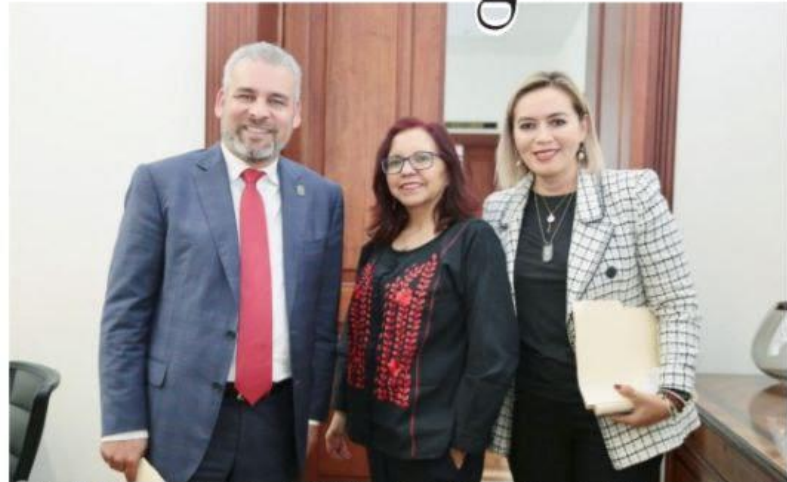
CDMX.- El gobernador, Alfredo Ramírez Bedolla, y la secretaria de Educación Pública, Leticia Ramírez Amaya, se comprometieron a darle seguimiento al proceso para la federalización de la nómina magisterial.