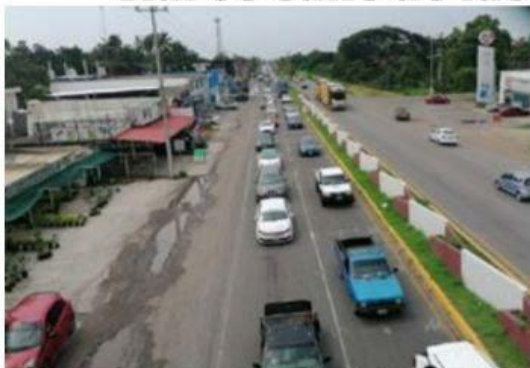
La avenida Las Palmas, convertida ya en un verdadero cuello de botella por el elevado tráfico de automóviles y del transporte urbano así como de carga, por la falta de construcción del Distribuidor Vial.

En Lázaro Cárdenas a falta de voluntad se camina hacia atrás, y el Distribuidor Vial es uno de los mejores ejemplos, porque el lugar donde se iba a construir pasó de un lugar de mediano... 10