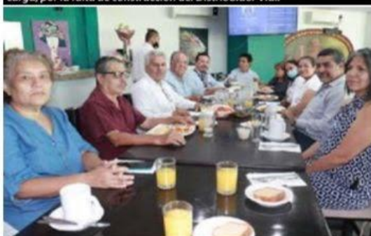
El día de ayer, personal de Gente del Balsas compartió un desayuno con amigos personales y del diario, en ocasión de celebrar su 28 aniversario de circulación ininterrumpida en esta región de la desembocadura del río Balsas.