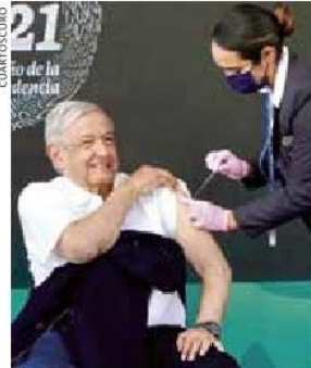
En gira. Inició la campaña de refuerzo para adultos mayores de 60 años.