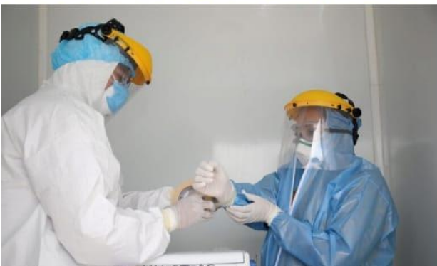
CD. LÁZARO CÁRDENAS, MICH.- El último caso Covid-19 registrado en el municipio de Lázaro Cárdenas, fue el pasado viernes, manteniendo estable la incidencia de contagio.

Sin aumento de casos Covid-19 en LC; el último se registró el pasado viernes PÁG. 4