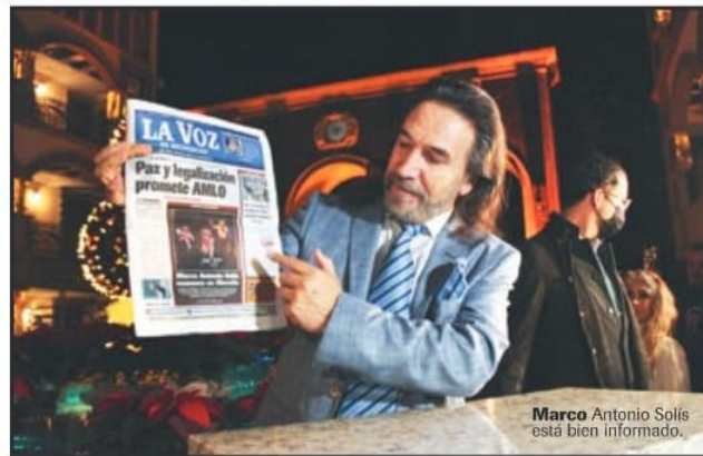
Marco Antonio Solís está bien informado.