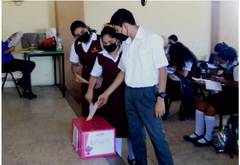
CD. LÁZARO CÁRDENAS, MICH.- Un total de 400 escuelas de la región colaboraron en la Consulta Infantil y Juvenil 2021, organizada por INE con apoyo de la SEE.

Encienden luces navideñas en la Asipona Lázaro Cárdenas PÁG. 3