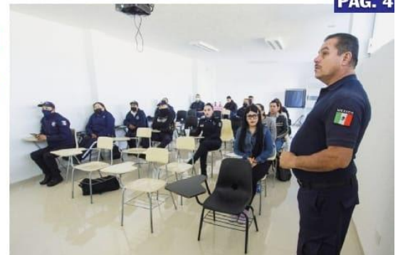
URUAPAN, MICH.- El tema de seguridad y su capacitación en las diferentes áreas, es una de las prioridades de la actual administración municipal.