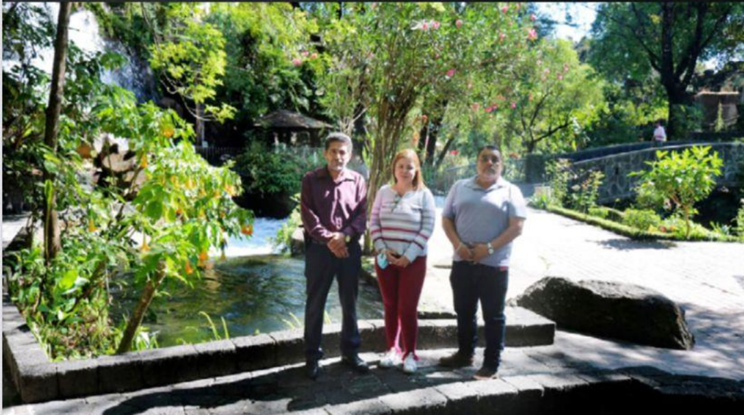
Uruapan, Mich. - Después de cinco meses de inactividad, las personas podrán disfrutar de cascadas, fuentes y aguas azules en el parque lineal Las Camelinas, que a partir del miércoles 8 de diciembre reabrirá sus puertas al público en general de manera habitual, en horarios de 08:00 a 17:00 horas.

Diputados se reunieron con el rector de la UMSNH para analizar presupuesto que se le asignará para el Ejercicio Fiscal 2022