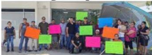
Habitantes de Aquila, se manifestaron ante las oficinas de CFE en Coahuayana, por el elevado costo de los recibos de luz.

Coahuayana, Mich., 8 de enero de 2024.- Un nutrido grupo de vecinos del pueblo de Aquila tomaron las oficinas de la Comisión Federal de Electricidad (CFE) ubicada en el la cabece- ➡ 5