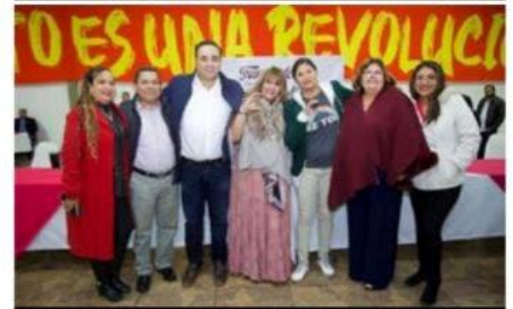
La Diputada comparte su visión para el nuevo año y celebra la diversidad y fortaleza del movimiento.