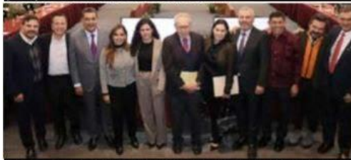
El 31 de marzo entrará en operación plena el IMSS-Bienestar en Michoacán y en otras 22 entidades que firmaron convenio: Bedolla.