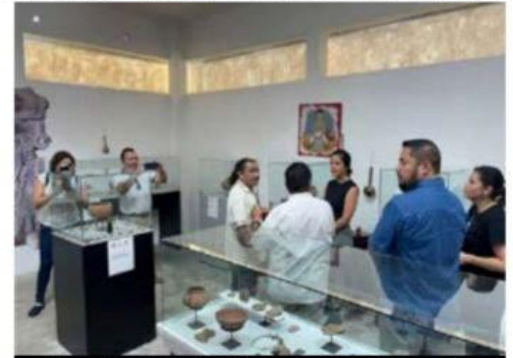
Aspecto de la sala de Arqueología del museo comunitario de LC.