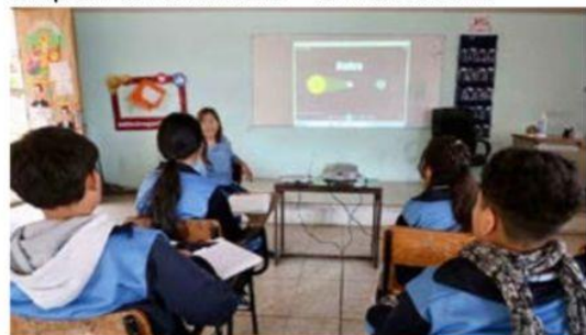
Niñas, niños y adolescentes viven fenómeno astronómico con acompañamiento de sus maestras y maestros.