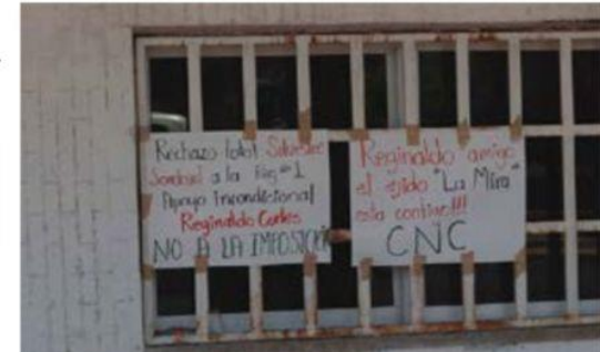
La CNC no quita el dedo del renglón y para presionar al PRI estatal a que baja a Silvestre Sandoval como candidato a primer regidor, mantiene tomadas las oficinas del PRI municipal, que por cierto, esas instalaciones son propiedad del sector campesino.