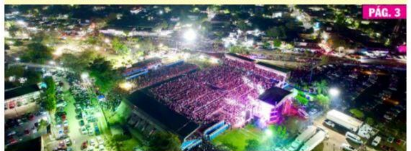
CD. LÁZARO CÁRDENAS, MICH.- La Expo Fiesta LZC 2024 cerró con broche de oro con la presentación estelar de Los Tucanes de Tijuana, la que fue disfrutada por más de 15 mil personas.