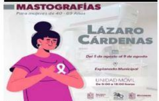
Para detectar oportunamente nuevos casos de cáncer de mama, la SSM realiza toma de mastografías en LC.