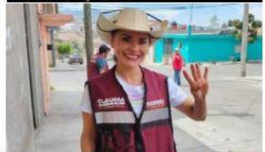
La Sala Regional Toluca del TEPJF confirmó el triunfo de Nalleli Pedraza Huerta como diputada local por el distrito 17 de Morelia.