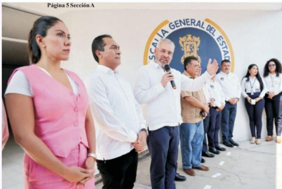
Página 5 Sección A