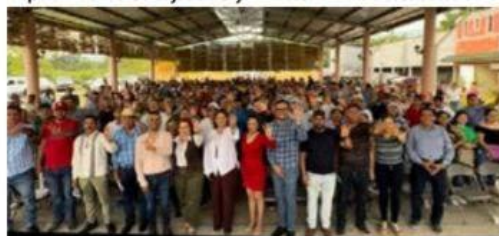
La aspirante a la candidatura al Senado de la República, tomó protesta a los integrantes de los Comités en Defensa de la Cuarta Transformación en Tacámbaro y Turicato.

En el marco de la toma de protesta de quienes integran los Comités en Defensa de la Cuarta