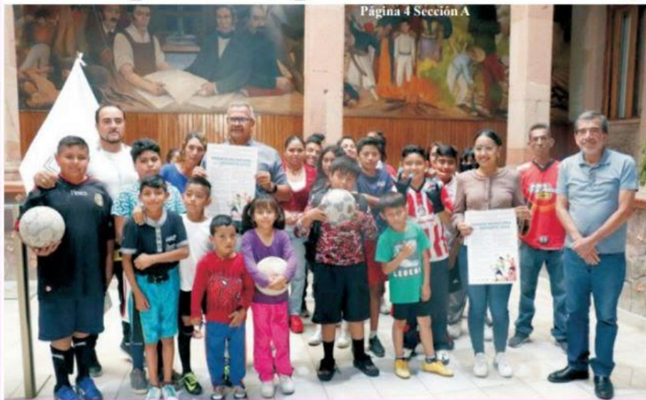
Página 4 Sección A