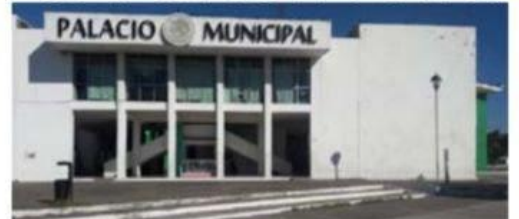
Con la publicación de la convocatoria de Morena para renovar, en el caso de Michoacán, las alcaldías y las diputaciones locales, aquí en LC, ya hay un alborotado de suspirantes a esos cargos.

El rico empresario fue detenido por su presunta responsabilidad en el delito de "Insolvencia fraudulenta en perjuicio de acreedores", aunque ha