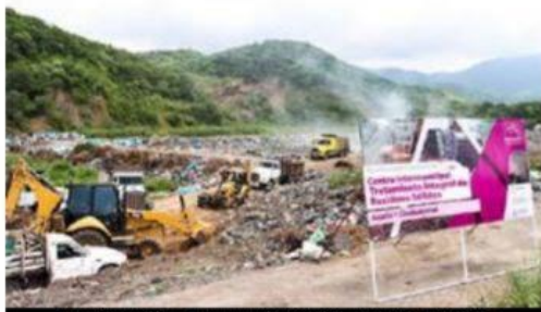
Se invierten 7.6 mdp en beneficio de 41 mil habitantes: SCOP.

Coahuayana, Michoacán, 8 de noviembre de 2023.- Con el objetivo de conformar un espacio propicio para el tratamiento de los residuos sólidos de la región Costa, la Secretaría de Comunicaciones y Obras Públicas (SCOP) construye el Centro Intermunicipal para el Tratamiento Integral de Residuos Sólidos (CITIRS) en la franja que colinda entre Coahuayana y Aquila.