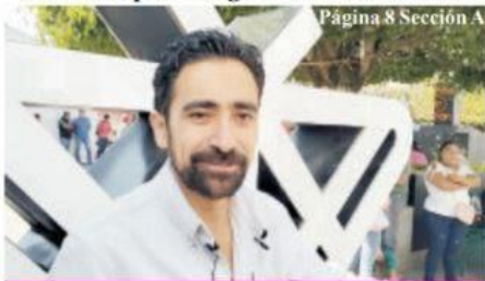
Página 8 Sección A