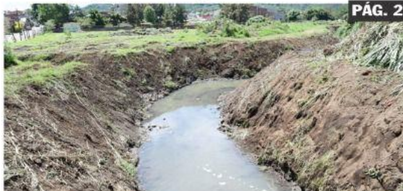
URUAPAN, MICH.- La Comisión de Agua Potable, Alcantarillado y Saneamiento de Uruapan se declara preparada para cualquier contingencia que se pueda presentar durante la temporada de lluvias.