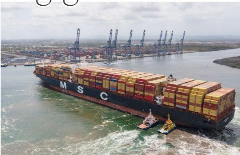
CD. LÁZARO CÁRDENAS, MICH.- Por segunda ocasión en la historia atraca en el puerto michoacano el barco de bandera panameña MSC Amsterdam, gracias a la infraestructura portuaria de primer nivel instalada en Lázaro Cárdenas.