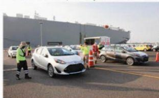
El puerto michoacano ha sido el que más ha crecido en el manejo de vehículos.

Si bien Veracruz manejó el mayor número de vehículos