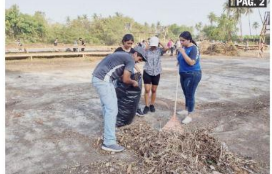
CD. LÁZARO CÁRDENAS, MICH.- El programa de Lázaro Cárdenas Limpio y Saludable, continúa aplicándose en el municipio de Lázaro Cárdenas.