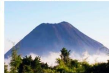
URUAPAN, MICH.- Al conmemorarse el 79 aniversario del nacimiento del Volcán Parícutín, se realizarán diversas actividades del 17 al 20 de este mes.