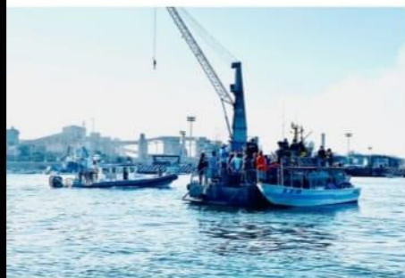
CD. LÁZARO CÁRDENAS, MICH.- Autoridades estatales y federales se comprometieron a no detener ni encarcelar a ningún directivo o pescador por los bloqueos realizados al Puerto en días pasados.

Otorgan autoridades impunidad a pescadores frente a bloqueos