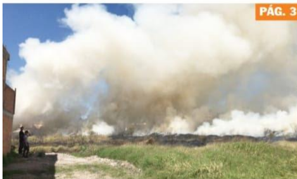
URUAPAN, MICH.- El gobierno municipal dio a conocer la estrategia que se seguirá para la prevención de incendios forestales.