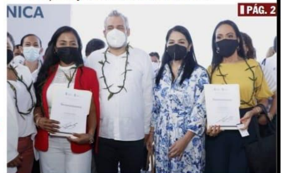
CD. LÁZARO CÁRDENAS, MICH.- El gobernador de Michoacán, Alfredo Ramírez Bedolla, hizo entrega de tres reconocimientos a la empresa ArcelorMittal por su contribución al desarrollo económico y social, por su responsabilidad social y por su programa de inversión comunitaria "Mujeres de Acero".