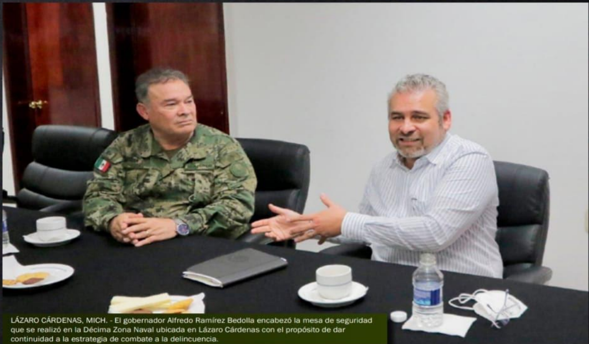
LÁZARO CÁRDENAS, MICH. - El gobernador Alfredo Ramírez Bedolla encabezó la mesa de seguridad que se realizó en la Décima Zona Naval ubicada en Lázaro Cárdenas con el propósito de dar continuidad a la estrategia de combate a la delincuencia.