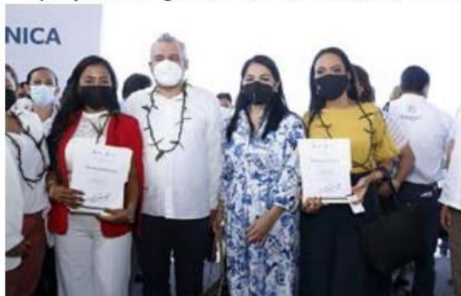
Las funcionarias de ArcelorMittal, en la foto del recuerdo con el gobernador Alfredo Ramírez Bedolla, luego de recibir de manos del mandatario estatal el reconocimiento a la labor que realizan en la región.

Ramírez Bedolla, hizo entrega de tres reconocimientos a la empresa ArcelorMittal por su contribución al desarrollo económico y social, por su responsabilidad ➔ 6