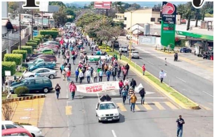
URUAPAN, MICH.- Integrantes y simpatizantes del ala sindical del magisterio Poder de Base, realizan ayer una marcha para exigir al gobierno del estado que se cumplan sus demandas; en tanto, en Lázaro Cárdenas la titular de la SEE, Yarabí Ávila, afirmó que se aplicará la ley en contra de mentores que trasgreden, pero no ahora.

Exposiciones, conferencias y conversatorio por el 79 aniversario del Parícutín