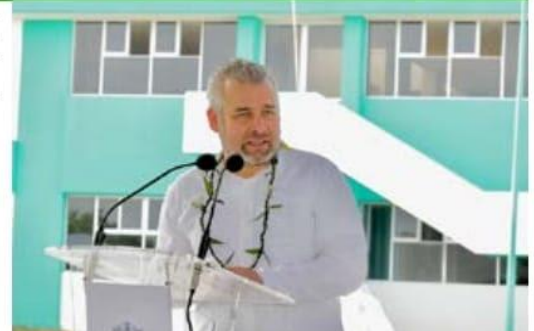
Ayer el gobernador Bedolla, al visitar la Universidad Politécnica de LC, exhortó a maestros y alumnos a regresar a las clases presenciales.

De visita por la Universidad Politéc. ➔ 6