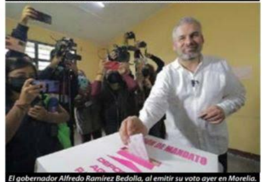
El gobernador Alfredo Ramírez Bedolla, al emitir su voto ayer en Morelia.