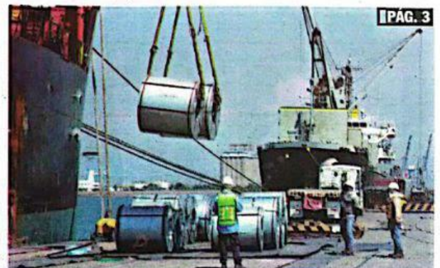
CD. LÁZARO CÁRDENAS, MICH.- La actividad portuaria en Lázaro Cárdenas ha mostrado un incremento sustancial durante los meses de enero y febrero este año.