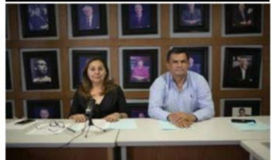
La gran mayoría de las y los michoacanos dieron la espalda a quien con una falsa consulta busca socavar el Estado Mexicano: CDE del PAN.