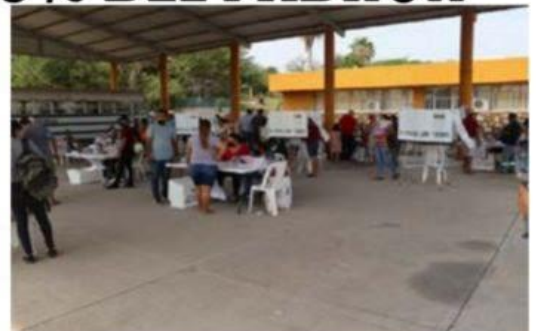
Uno de los sitios que registró buena afluencia de votantes ayer, fue en el interior de las instalaciones del ITLAC. (Foto: Kike Rivera).