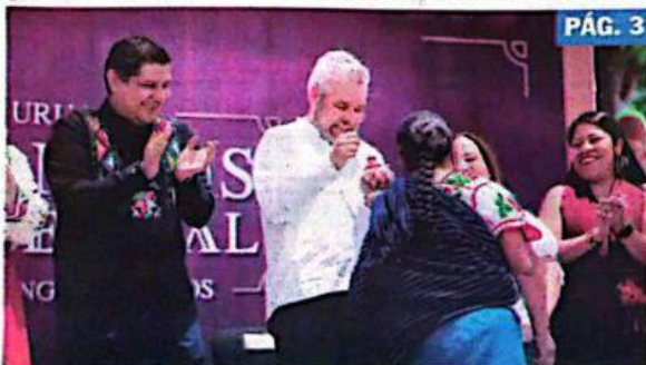
URUAPAN, MICH.- El gobernador, Alfredo Ramírez Bedolla, y el alcalde, Ignacio Campos, encabezaron la ceremonia de entrega de premios a los ganadores de los concursos estatales de Artesanías y de Indumentaria Tradicional.