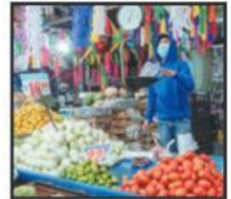
La escalada de precios en los productos básicos merma la economía.

Mientras que las cifras a nivel nacional se mantienen alrededor de un 7.45 puntos porcentuales, Michoacán ya casi se ubica un punto arriba, con una inflación del 8.41%, esto de acuerdo al Instituto Nacional de Geografía y Estadística (INEGI). Conforme al Banco de México y diversos analistas esta tendencia inflacionaria no cederá durante este año 2022 e incluso se espera que la tasa de interés de referencia llegue a un 8.0% a nivel nacional para el mes de diciembre. Este panorama obligará a los gobiernos a tomar nuevas medidas, perspectivas y apuntalar cambios económicos y administrativos para el 2022 y 2023 puesto que factores como la persistencia de la pandemia y la contracción de la economía mundial debido la invasión de Rusia a Ucrania incidirán negativamente en las cifras.