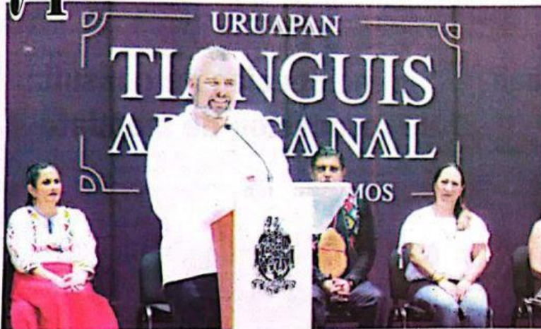
URUAPAN, MICH.- El gobernador, Alfredo Ramírez Bedolla, reconoció la importancia que la cultura y el arte tienen para la pacificación del estado, al encabezar la premiación del LXI Concurso Estatal de Artesanías de Domingo de Ramos en Uruapan.