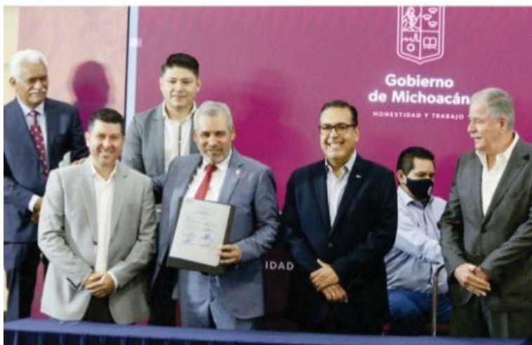
ORELIA, MICH.- En un esfuerzo coordinado con dependencias del gobierno federal y empresas de diversos sectores para contener incrementos en precios de productos y servicios por los próximos seis meses, ayer se puso en marcha la estrategia Michoacán sin carestía.

Esfuerzo coordinado para contener incrementos en productos y servicios por los próximos 6 meses PÁG. 3