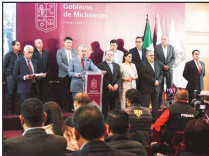
EL GOBERNADOR ALFREDO RAMÍREZ BEDOLLA -ACOMPAÑADO POR MIEMBROS DE SU GABINETE-, REPRESENTANTES DE LA FEDERACIÓN Y EMPRESARIOS UNIFICARON FUERZAS PARA CONTENER LA ESCALADA DE PRECIOS.