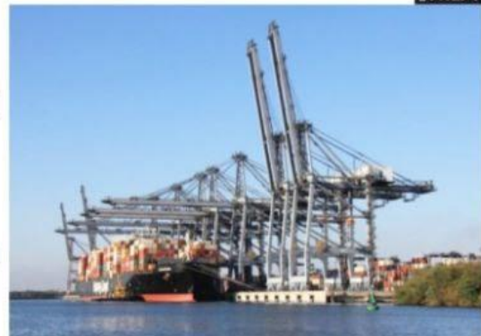
CD. LÁZARO CÁRDENAS, MICH.- De acuerdo con el PPEF 2023, enviado a la Cámara de Diputados, las Administraciones Portuarias Integrales de Veracruz, Altamira y Lázaro Cárdenas concentrarían 83% de los recursos planteados para inversiones físicas.

La sede será la biblioteca pública Álvaro Obregón PÁG. 2