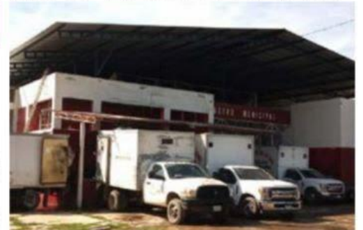
Una de las mejoras que se han implementado en el Rastro Municipal, es la utilización de un mejor equipo motriz para el transporte de la carne hacia los mercados y centros de distribución del alimento.

alumnos de la escuela Josefa Ortiz de Domínguez puso en este munic- >>> 2