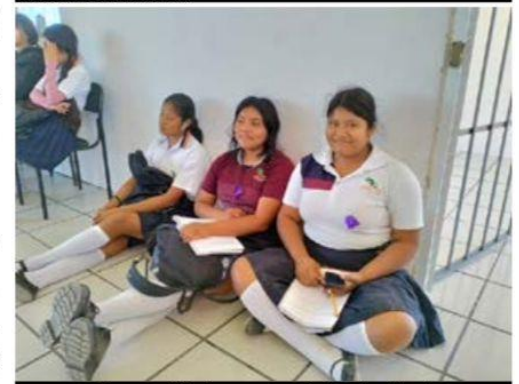
Ofrece también clases extracurriculares de náhuatl.