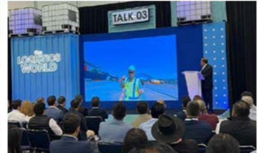
El Puerto Lázaro Cárdenas registra cifras récord de 35% en el incremento de movimiento de carga, según se informó durante el 10º aniversario del Subcomité de Promoción.

Política con la izquierda EL GUACHOMA Újule patrón, no cabe duda de que el trabajo no es llegar, sino sostenerse, dicen las malas lenguas, y digo malas porque se ve que destellan mucho coraje, quien sabe por qué, pero se nota, » 7