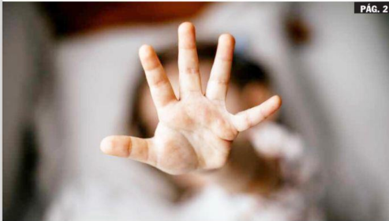
URUAPAN, MICH.- Los seres más vulnerables, que son los niños, siguen siendo en un alto porcentaje víctimas de violencia, que incluye maltrato físico o psicológico, abuso sexual, desatención, negligencia y explotación comercial o de otro tipos.