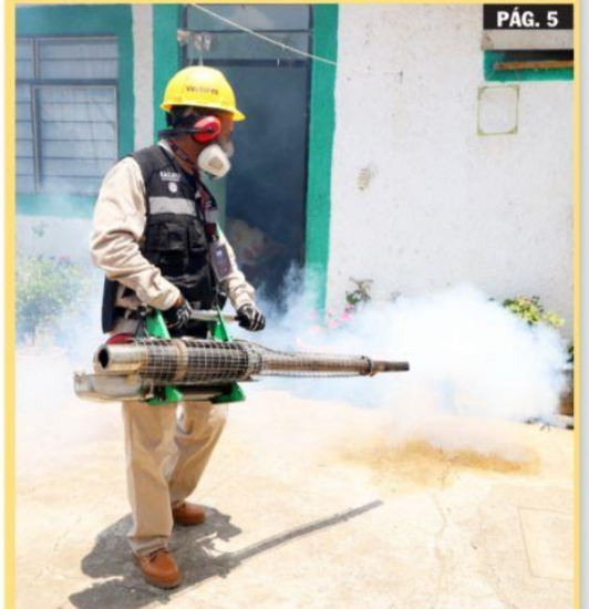
URUAPAN, MICH.- Se dice en la SSM que Uruapan está incluido en las acciones preventivas para erradicar los factores causantes de dengue, cuyo padecimiento ha crecido en esta región.