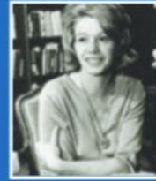
Elena Garro, legado perpetuo en las letras.