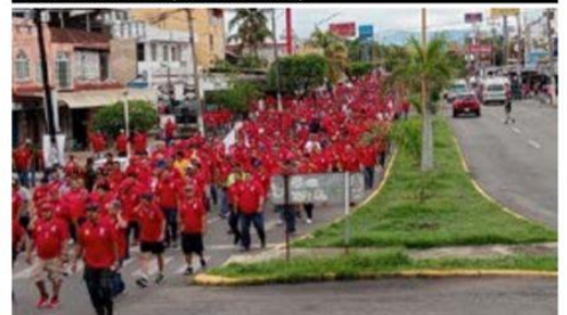
Esta vez sin fiesta, como es la costumbre, los mineros de Lázaro Cárdenas solo marcharon para conmemorar el "Día del Minero". (Foto: Kike Rivera).