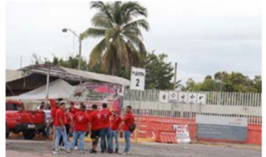
Un Juez federal negó amparo a los mineros de la 271, y ratificó que es ilegal y va contra la ley y la Constitución el bloqueo de todas las instalaciones de ArcelorMittal.