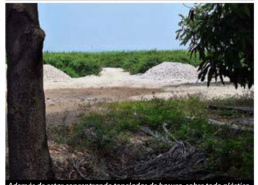
Además de estar concentrando toneladas de basura, sobre todo plástico, parte de la laguna costera El Caimán, está siendo rellenada por particulares para ser utilizado el sitio como un patio industrial.