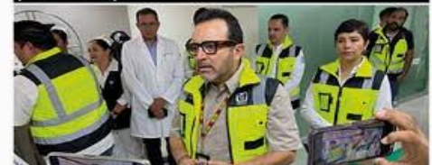
El delegado estatal del IMSS durante la entrevista concedida a este diario.