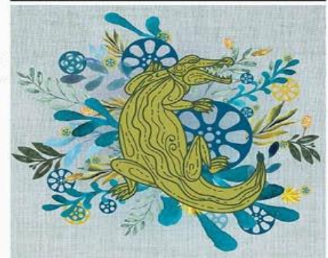
Ya está la convocatoria para participar en el Festival Internacional de Cine del Balsas 2024.

EL GUACHOMA Empezó la cuenta patrón, hasta el día de ayer a eso de las 9 de la noche ya iban los primeros 6 congresos locales que habían aprobado la reforma judicial y uno que la desechó, Oaxaca, Quintana Roo, >> 8