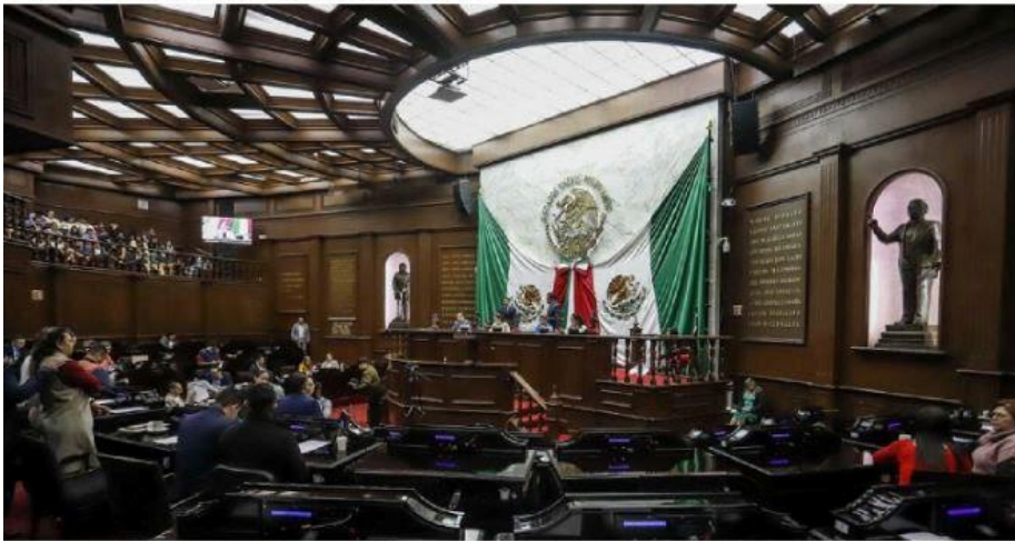
MORELIA, MICH.- Michoacán, dentro del gran constituyente, votará a través del Congreso del Estado, la reforma judicial este viernes.