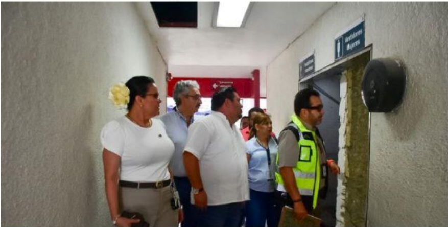
CD. LÁZARO CÁRDENAS, MICH.- Autoridades municipales y del IMSS supervisan las obras en el área de hospitalización y laboratorio del HGZ-MF No. 12, en beneficio de los derechohabientes de Lázaro Cárdenas.