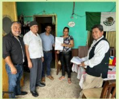
CD. LÁZARO CÁRDENAS, MICH.- Residentes de la colonia El Veladero reciben sus escrituras como parte del programa de escrituración gratuita, impulsado por el ayuntamiento de Lázaro Cárdenas y el Insus.