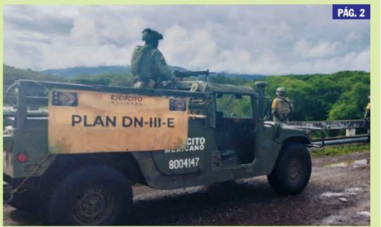
CD. LÁZARO CÁRDENAS, MICH.- Ante las constantes lluvias, elementos de Sedena intensificaron la vigilancia de ríos y canales, con el objetivo prevenir riesgos a la población.