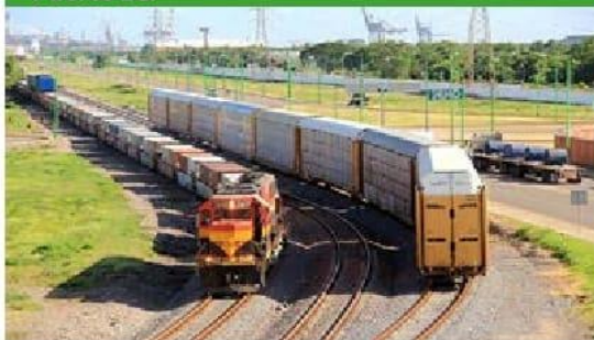
Luego de los problemas generados por bloqueos a las vías del tren, la ferroviaria KCSM, dio a conocer su decisión de seguir invirtiendo en LC, luego de que el año pasado dejara entretener que ya no lo haría.

Al informar que la ferroviaria realizará una inversión en el país de ➡ 6