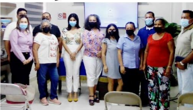
CD. LÁZARO CÁRDENAS, MICH.- Ayer rindieron protesta los nuevos consejeros que formarán parte del nuevo periodo del Consejo Municipal de Ecología.

■ Ampliar el programa de vacunación a este sector abonará a mantener un ambiente sano en escuelas, asegura PAG. 9