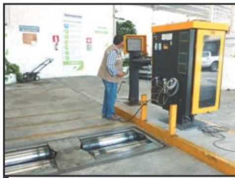
LOS VERIFICENTROS DESDE HACE AÑOS ENTRARON EN CRISIS POR LA FALTA DE INTERÉS DE LA CIUDADANÍA EN REALIZAR LA PRUEBA.