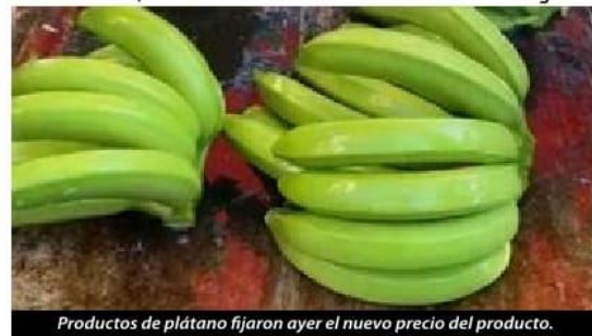
Productos de plátano fijaron ayer el nuevo precio del producto.