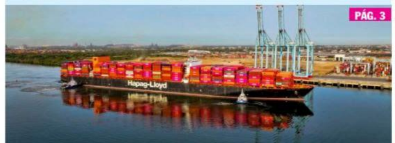
CD. LÁZARO CÁRDENAS, MICH.- El Puerto Lázaro Cárdenas ha sido seleccionado para ser parte de los puertos de recalada del itinerario del servicio EC2 de Hapag-Lloyd, con operaciones de descarga de contenedores de importación procedentes de puertos asiáticos.