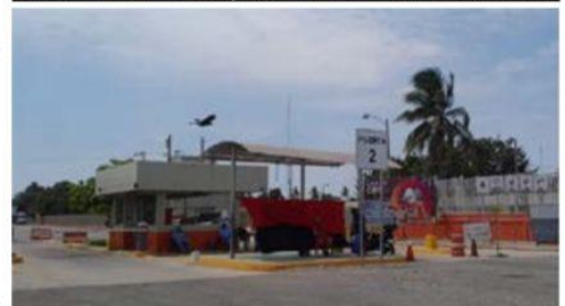
La colocación de banderas rojinegras de huelga en todas sus instalaciones y el paro de sus trabajadores sindicalizados es ilegal, reiteró ayer la empresa ArcelorMittal.