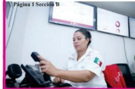
Página 1 Sección B

Vamos a cumplir con los compromisos que hicimos, no son promesas: Claudia Sheinbaum, anuncia arranque de nuevos programas sociales con mujeres de 60 a 64 años y adolescentes de todo el país