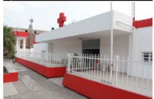
La delegación local de la Cruz Roja, recién remodelada, ofrece infinidad de servicios médicos y de enfermería.