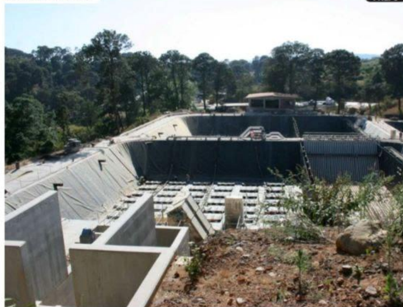
URUAPAN, MICH.- Con la puesta en marcha de la planta tratadora de aguas residuales San Antonio se saneará el treinta por ciento de las aguas negras que se generan en esta ciudad.