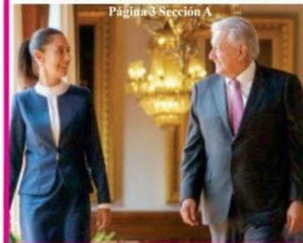
Página 3 Sección A

Se logran acuerdos entre autoridades y policías; se dispersan pagos y se abre la circulación