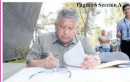
Página 6 Sección A

Promueve FGE prevención del bullying o acoso escolar en escuela secundaria de Maravatío