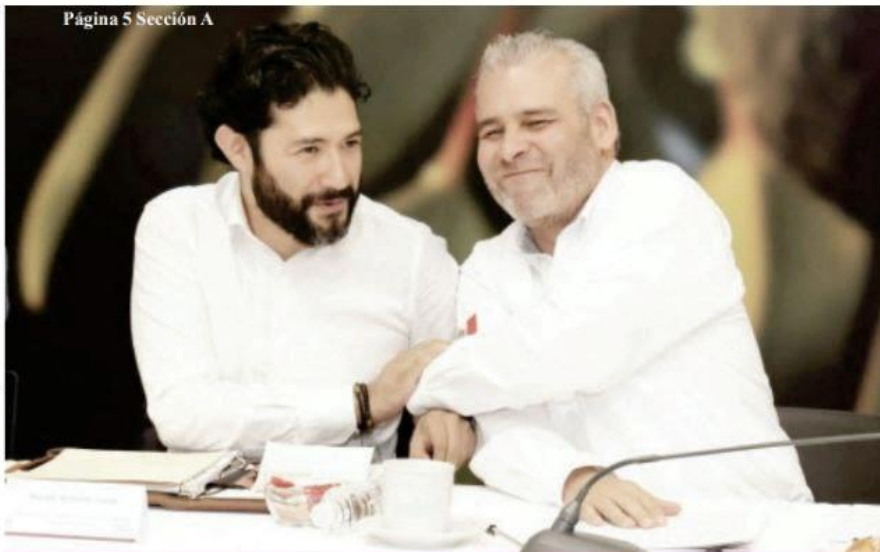
Página 5 Sección A

Llama a la línea Hablemos para recibir atención a la salud mental