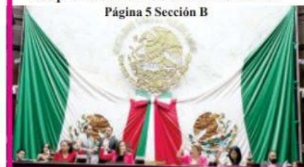
Página 5 Sección B

Michoacán, a la vanguardia en América Latina con tecnología verde para purificación del aire