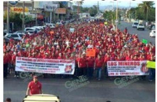
Si otra cosa no sucede de última hora, mañana viernes por la tarde, los mineros de la 271 y de otras secciones, realizaron una gran marcha desde el Monumento al Minero a la puerta 2 de ArcelorMittal. (Foto de archivo).