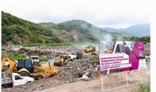
Con una inversión de 57.1 mdp se pretende beneficiar a 760 mil michoacanos. La obra en la costa norte de la entidad, lleva un avance del 18%.