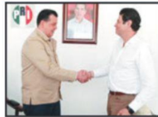
Valencia y Martínez, en pro del Frente Amplio.