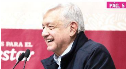
CIUDAD DE MÉXICO.- López Obrador enviará una iniciativa de ley al Congreso de la Unión para mantener el cobro de IVA e ISR al 50%; además, se cuidará que el precio de los combustibles no aumente en términos reales.