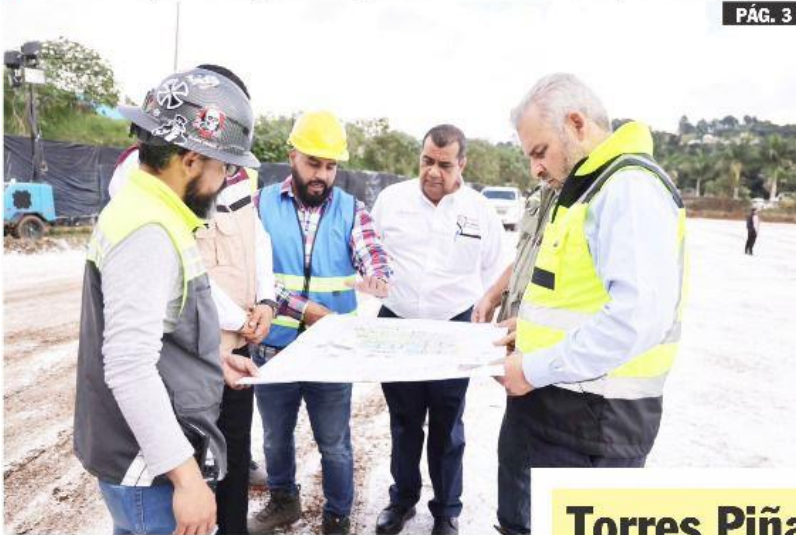
URUAPAN, MICH.- El gobernador del estado, Alfredo Ramírez Bedolla, reconoció la magnitud de lo que representará el nuevo hospital del IMSS para Uruapan y la región.