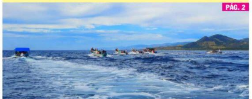
CD. LÁZARO CÁRDENAS, MICH.- Una tradición ya arraigada entre pescadores y lugareños es la procesión marítima que año con año se realiza saliendo desde Caleta de Campos, en la que durante tres horas pasean por el mar la imagen de la Virgen de Guadalupe.