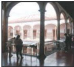
LA PREPA 1, CON MAYOR DÉFICIT DE ESPACIOS FÍSICOS PARA ALUMNOS.

El aumento de la matrícula en el ciclo escolar obliga a la UMSNH a solicitar dichos espacios para atender la demanda.