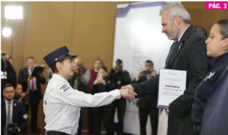
MORELIA, MICH.- El gobernador Alfredo Ramírez Bedolla hizo un reconocimiento a la labor de elementos de la Guardia Civil, exhortándolos a mantenerse unidos y fortalecer la estrategia de seguridad.

► El gobernador reconoció la labor de la Guardia Civil PÁG. 3