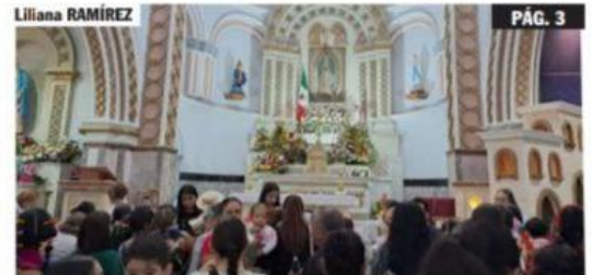
URUAPAN, MICH.- El pueblo uruapense ratificó su devoción y fe a la Virgen de Guadalupe, asistiendo a los oficios religiosos que se celebraron ayer en esta ciudad, en el 492 Aniversario de sus apariciones a San Juan Diego.