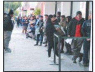
Este viernes concluye el Buen Fin Vehicular.