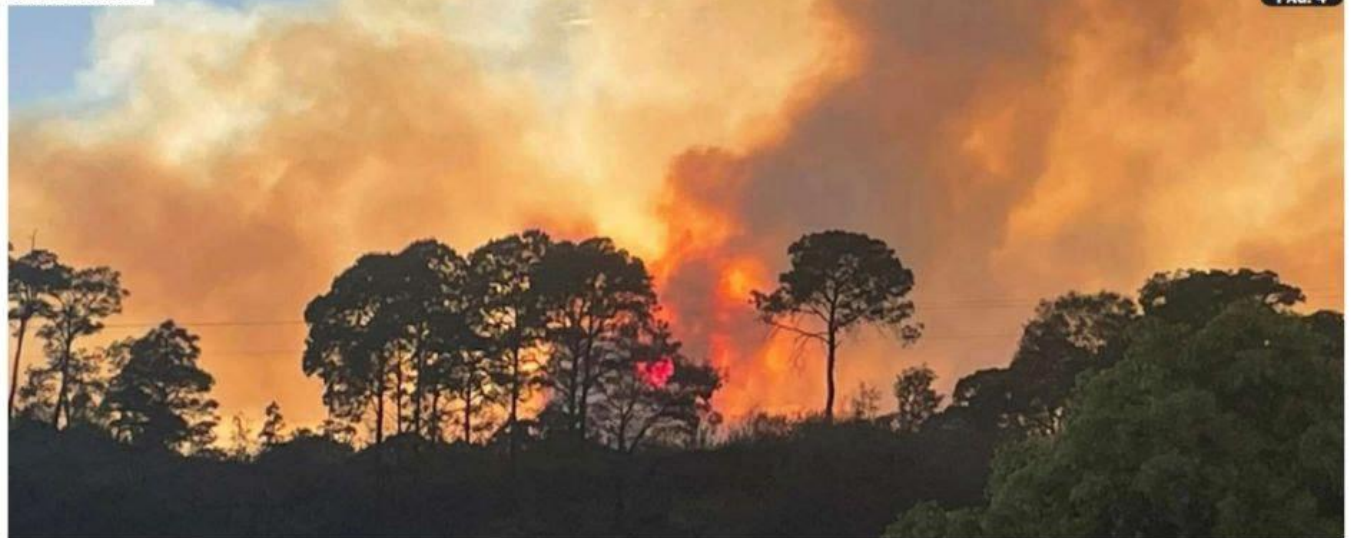
URUAPAN, MICH.- Una densa y extensa capa de humo cubrió toda la ciudad y la región, a causa de dos intensos incendios forestales registrados al sur del municipio y a pesar de la magnitud, no se emitió alerta por contingencia, sólo hubo recomendaciones de Protección Civil.