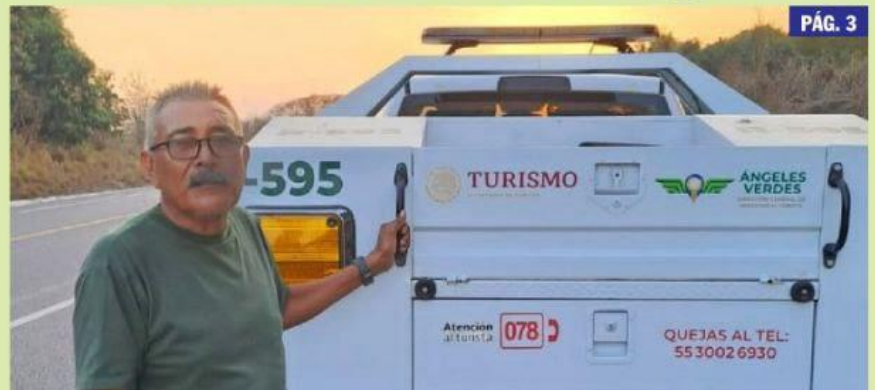
CD. LÁZARO CÁRDENAS, MICH.- Personal de los Ángeles Verdes está atento para brindar asistencia a vehículo que transitan sobre la autopista Siglo XXI.

Ángeles Verdes auxilian a automovilistas en la Siglo XXI PÁG. 3