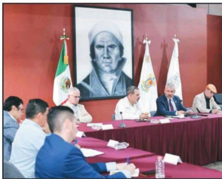
EN CASA MICHOACÁN, EL GOBERNADOR ALFREDO RAMÍREZ BEDOLLA, ACOMPAÑADO DE MIEMBROS DE SU GABINETE, PRESENTÓ A DIRECTIVOS AGUACATEROS EL PROYECTO DE LA CERTIFICACIÓN ESTATAL.