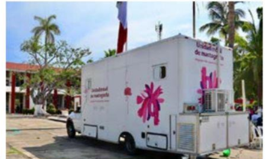
Además de LC, la SSM estará realizando pruebas gratuitas de mastografías en la cabecera municipal de Arteaga, para la detección oportuna del cáncer de mama.