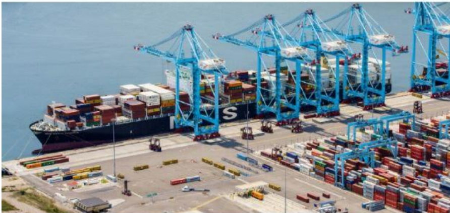
CD. LÁZARO CÁRDENAS, MICH.- APM Terminals México reporta resultados positivos en los puertos de Lázaro Cárdenas y Progreso, con un movimiento total de carga de 475, 920 TEU's durante el primer semestre del año.

■ En sus terminales de Lázaro Cárdenas y Puerto Progreso PÁG. 3