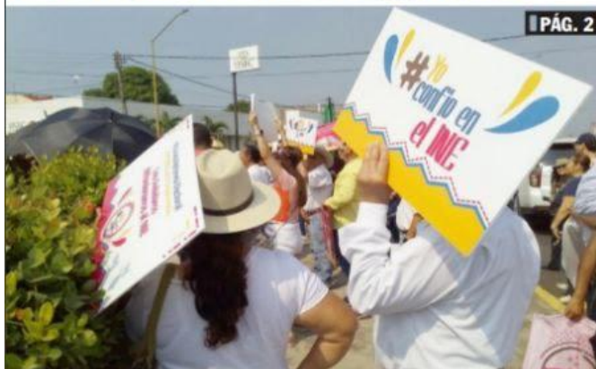
CD. LÁZARO CÁRDENAS, MICH.- De aprobarse la iniciativa de reforma electoral, en Lázaro Cárdenas se reduciría el número de regidores a solo 3.