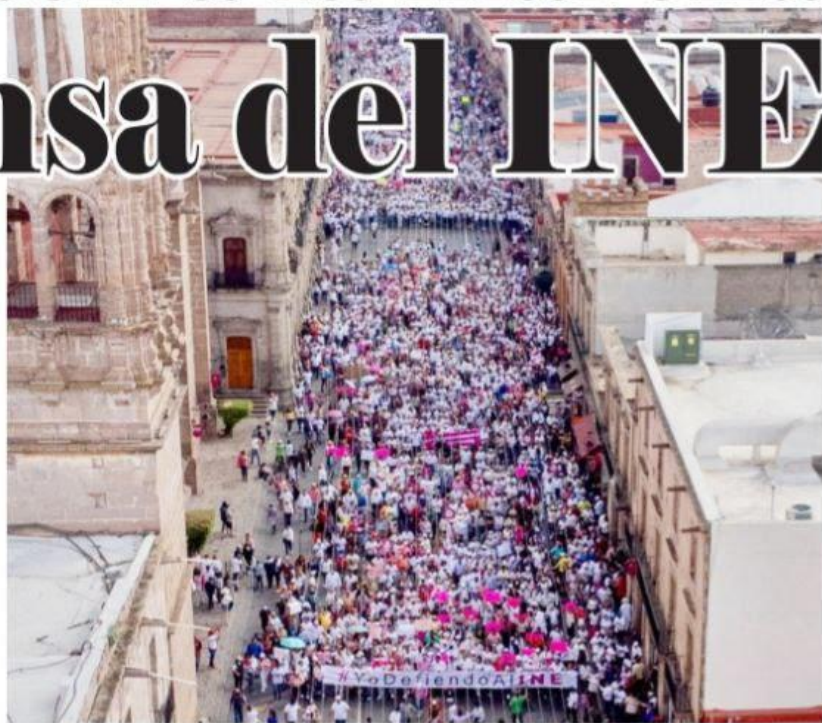
CD. LÁZARO CÁRDENAS, MICH.- Miles de personas marcharon el domingo en muchos puntos de la República, y el puerto de Lázaro Cárdenas también se hizo presente.