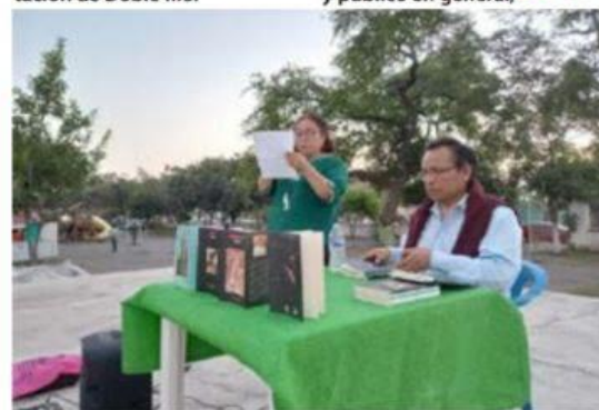
El pasado fin de semana, Sueño Colectivo, conmemoró en este puerto, el Día Nacional del Libro.

En punto de las seis de la tarde y ante poetas y público en general, >>> 2