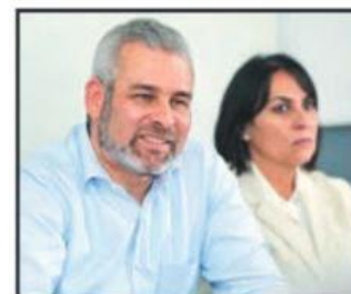
El gobernador Alfredo Ramírez Bedolla anunció los apoyos en salud para las michoacanas.

Michoacanas de entre 18 y 64 años de edad que padezcan cáncer de mama o cervicouterino podrían acceder a un apoyo mensual que será subsidiado por el gobierno del estado, anticipó Alfredo Ramírez Bedolla, tras destacar que la finalidad es mejorar su calidad de vida.