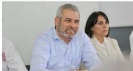
El gobernador Bedolla anunció apoyos para mujeres con cáncer de mama y cervicouterino.