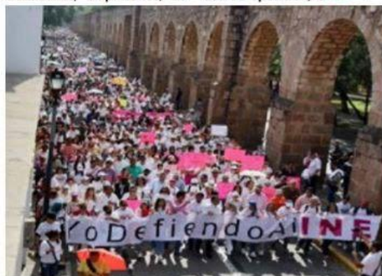
Muy nutrida fue la marcha en defensa del INE y de un no a la reforma electoral de AMLO, en la capital del estado, Morelia.