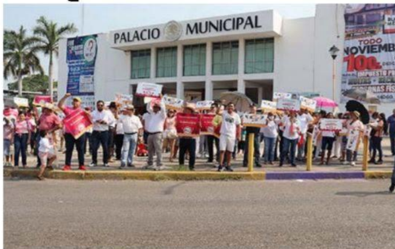
Quienes marcharon ayer aquí en respaldo al INE y en contra de la reforma electoral del presidente AMLO, hicieron un alto para corear sus consignas frente al acceso principal del palacio municipal. (Foto: Kike Rivera).

Morelia, Mich., 13 de noviembre de 2022.- Miles de ciudadanos, empresarios, ac- tivistas, militantes de partidos, alcaldes, diputa- dos de oposición, e >>> 2