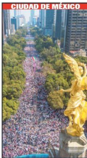
En la CdMx más de 250 mil personas, según los organizadores, desfilaron al grito de "El INE no se toca".