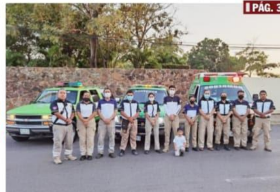
CD. LÁZARO CÁRDENAS, MICH.- Ayer 14 de febrero, el cuerpo de Rescate