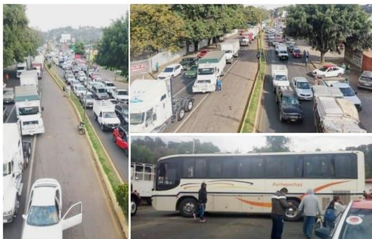
URUAPAN, MICH.- Tras la destrucción del monumento a los "Constructores" en Morelia, y la detención por su presunta responsabilidad de 24 integrantes del Consejo Supremo Indígena de Michoacán, hubo bloqueos en varios puntos carreteros en Michoacán, con la consecuente paralización del tráfico vehicular, formándose filas de varios kilómetros.