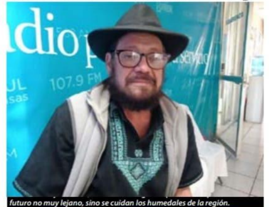
futuro no muy lejano, sino se cuidan los humedales de la región.