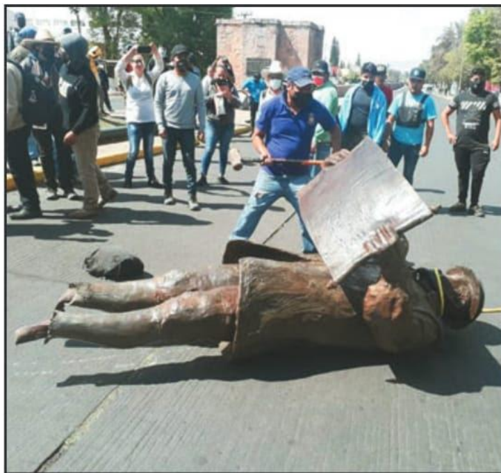
UN GRUPO DE PERSONAS CON MARROS Y CUERDAS DERRIBARON Y ARRANCARON LA CABEZA A LA ESTATUA DE FRAY ANTONIO DE SAN MIGUEL, EN EL MONUMENTO A LOS CONSTRUCTORES.