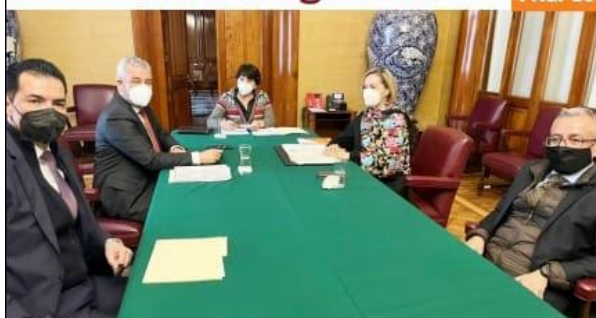
CIUDAD DE MÉXICO.- Ayer, el gobernador Alfredo Ramírez Bedolla, y la secretaria de Educación del Estado, Yarabí Ávila González, se reunieron con la secretaria de Educación Pública del gobierno federal, Delfina Gómez Álvarez, para dar