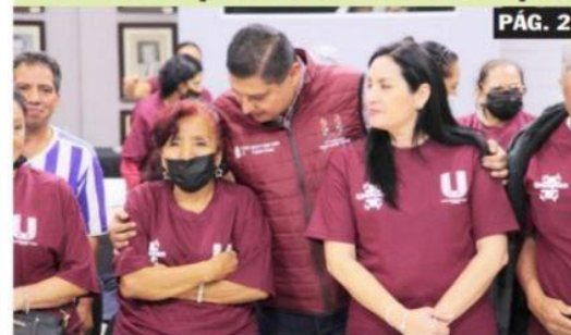
URUAPAN, MICH.- Con el respaldo del gobierno que encabeza Ignacio Campos Equihua, veintidós adultos mayores salieron anoche a la Embajada de EU en la CDMX, para tramitar sus visas y así poder reencontrarse con sus familiares, que no han visto en décadas.