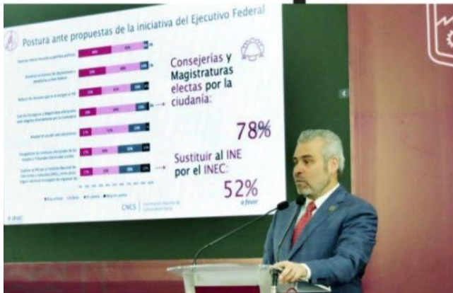
MORELIA, MICH.- El gobernador del Estado, Alfredo Ramírez Bedolla, aclara que el INE no desaparece con la Reforma Electoral que propone el presidente de la República, Andrés Manuel López Obrador.