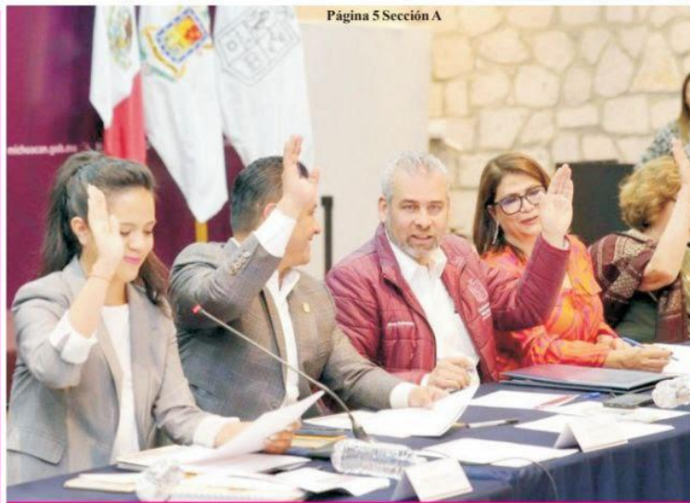
Página 5 Sección A