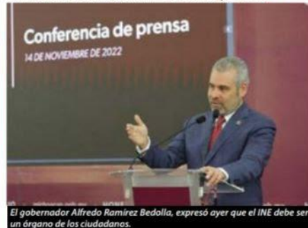
El gobernador Alfredo Ramírez Bedolla, expresó ayer que el INE debe ser un órgano de los ciudadanos.