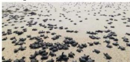
Más de 50 mil crías de tortuga Golfina fueron liberadas el pasado fin de semana en Ixtapilla, al cumplirse el 27 aniversario de dicho campamento, ahora llamado Punta Ixtal, en el municipio de Aquila, Mich.