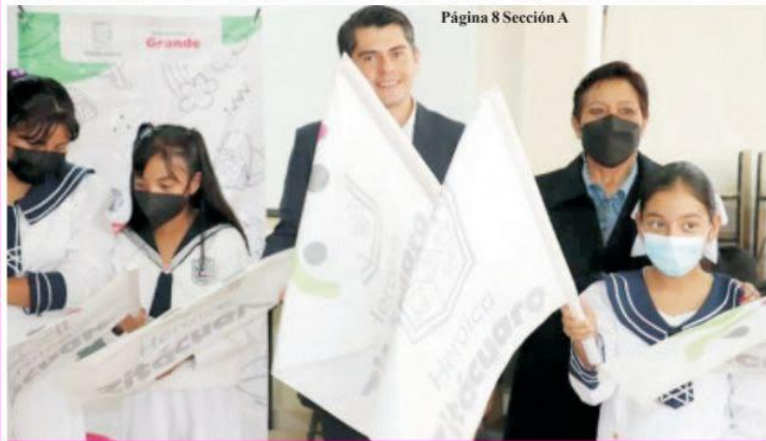
Página 8 Sección A