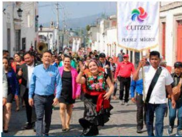
El orgulloso Pueblo Mágico de Cuitzeo