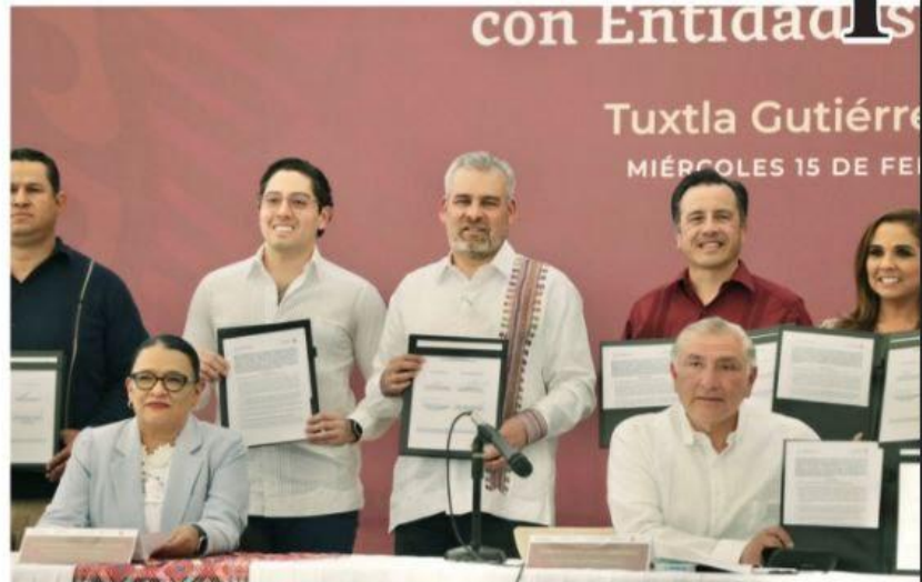
TUXTLA GUTIÉRREZ, CHIS.- El gobernador michoacano, Alfredo Ramírez Bedolla, y sus similares de Campeche, Guanajuato, Nayarit, Oaxaca, Quintana Roo, Tabasco, Veracruz, Yucatán y Jalisco, firmaron convenios de coordinación del Fondo de Aportaciones para la Seguridad Pública.

Bajas ventas y en algunos casos pérdidas, en el Día del Amor