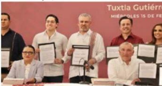
El gobernador destacó el compromiso de formar un frente común entre estados y federación para preservar la paz.

convenios de coordinación del Fondo de Aportaciones para la Seguridad Pública (FASP) 2023, donde Michoacán accederá a 296 mi- » 3