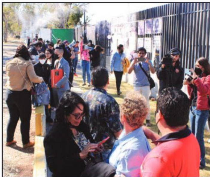
FINALMENTE, TRAS 2 AÑOS DE PROCESO JUDICIAL, SE HIZO JUSTICIA EN EL CASO QUE MOVIO LAS CONCIENCIAS DE LA CIUDADANÍA; FAMILIARES Y ACTIVISTAS, ENTRE LÁGRIMAS, SE CONFORMARON CON LA SENTENCIA.