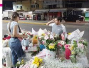
CD. LAZARO CÁRDENAS, MICH.- Comerciantes que ofertaron sus productos con motivo del Día del Amor y la Amistad coincidieron que las ventas no fueron tan buenas como en años anteriores.