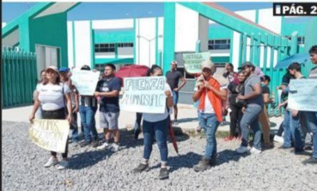
CD. LAZARO CÁRDENAS, MICH.- Alumnos de la Universidad Politécnica exigen una pronta solución a la huelga que los mantiene sin clases desde la semana pasada.