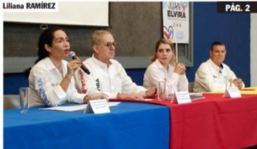
URUAPAN, MICH.- Candidatos de la alianza aplicarán inteligencia social para mejorar seguridad.