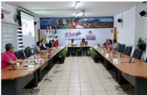
Aquellas candidaturas que cumplieron con todos los requisitos debieron iniciar campaña a partir de ayer lunes.

Morelia, Michoacán a 13 de abril de 2024.- El Consejo General del Instituto Electoral de Michoacán (IEM), en sesión extraordinaria urgente, aprobó otorgar las candidaturas a quienes cumplieron con todos los requerimientos de ley correspondientes y que competirán por 1,137 cargos de elección popular: 40 diputaciones, 112 Presidencias Municipales, 112 Sindicaturas y 873 Regidurías en el que podrán votar 3 millones 748 mil 973 michoacanos y michoacanos el próximo 2 de junio. Tras 10 días de 2