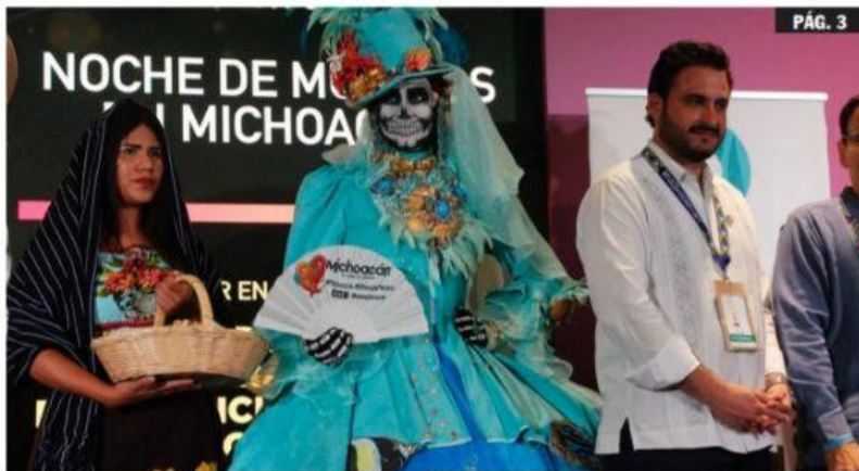
MORELIA, MICH.- Con la presentación de sus atractivos naturales y la belleza de sus tradiciones, Michoacán cautivó en el Tianguis Turístico de Acapulco 2024.