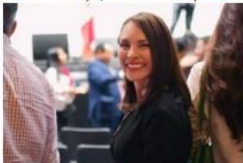
Celebra Secretaria de Mexicanas y Mexicanas en el Exterior del CEN MORENA, entrega de constancia por parte de la TEPJF a Claudia Sheinbaum.

cho que hoy se consolida con la recepción de la constancia como primera Presidenta Electa que >>> 8