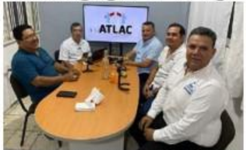
Los dirigentes de la Conatram, CCE región LC, ATLAS y Canaco-Servytur y Fecanaco-Michoacán, externaron anoche sus opiniones en torno a lo que dijeron, era un sueño guajiro, de ampliar la caserna 200 a 4 carriles.

Pacífico, sumando nueva infraestructura en el puerto michoacano, así es la propuesta plantea >>> 7