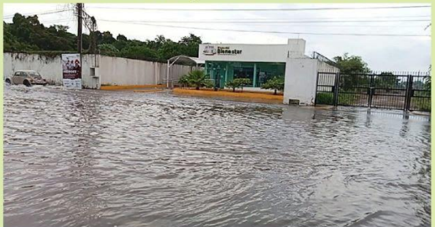
CD. LÁZARO CÁRDENAS, MICH.- Usuarios del Banco del Bienestar en esta ciudad se ven imposibilitados a acceder a los cajeros automáticos debido a que el nivel del agua en la vialidad sube considerablemente cuando hay lluvia.