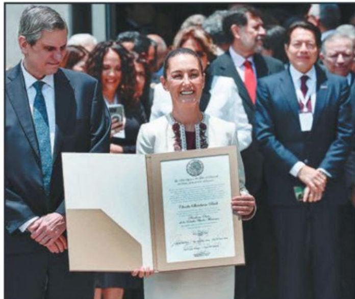
EN UN HECHO QUE MARCA LA HISTORIA DE MÉXICO, CLAUDIA SHEINBAUM PARDO RECIBIÓ LA CONSTANCIA DE MAYORÍA QUE LA ACREDITA OFICIALMENTE COMO LA PRIMERA PRESIDENTA ELECTA.

Sheinbaum, en magna celebración en el teatro Metropolitano de la Ciudad de México, reiteró su compromiso de seguir con el legado de la cuarta transformación, estructurado por el presidente Andrés Manuel López Obrador; al inicio de su gobierno, en octubre, detallará los 100 puntos principales de gestión.