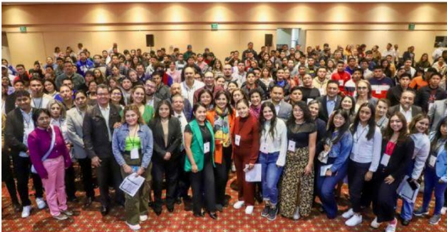
MORELIA, MICH.- SEE da certeza a 430 trabajadores que han obtenido su plaza con transparencia y en apego a la normativa.

Emite alerta Protección Civil por lluvias intensas en Lázaro Cárdenas