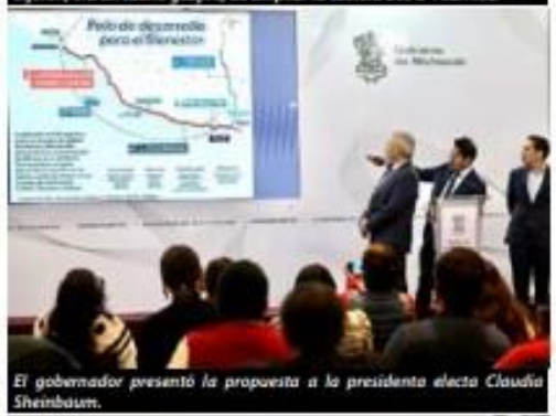
El gobernador presentó la propuesta a la presidenta electa Claudia Sheinbaum.

El día de ayer se puso en marcha el Centro de Conciliación Laboral en este municipio, el cual como su principal función será mediar los conflictos laborales entre patrones y trabajadores, jus- >>> 2