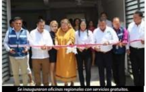
Se inauguraron oficinas regionales con servicios gratuitos.