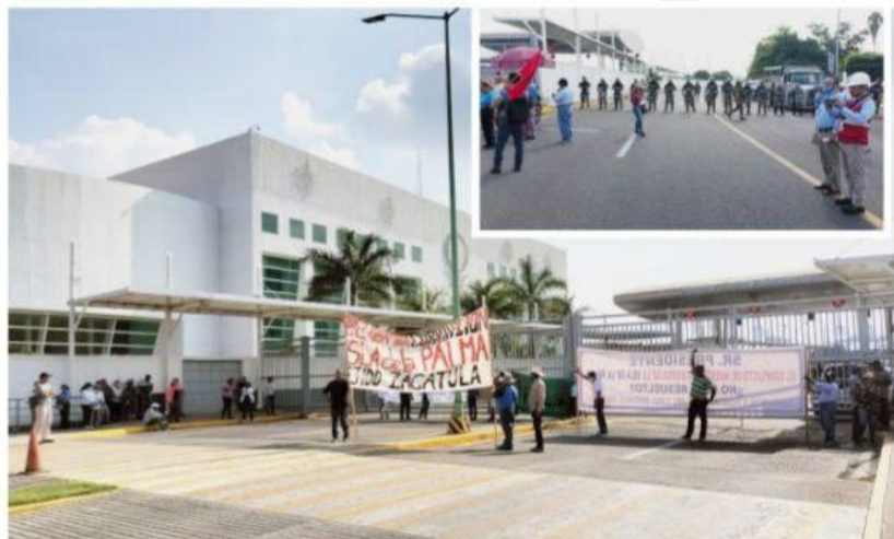
CD. LÁZARO CÁRDENAS, MICH.- Ejidatarios y poseedores de la Isla de la Palma protestaron contra las autoridades estatales y federales, y contra la Administración del Sistema Portuario Nacional ya que aun que existen litigios ejidales ante los tribunales agrarios por el tema de la Isla de la Palma.