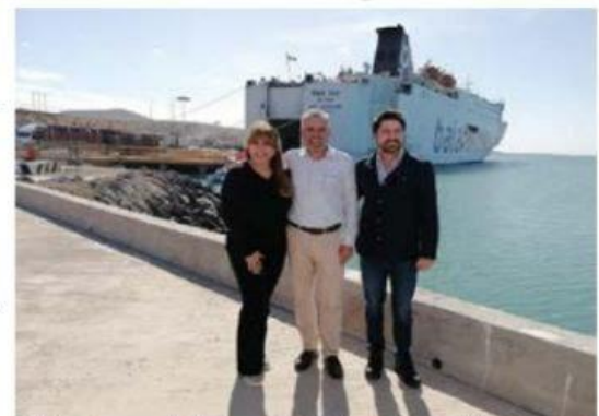
Michoacán, a través de Puerto LC y BCS buscarán consolidar el cabotaje marítimo en el Pacífico mexicano: Bedolla.