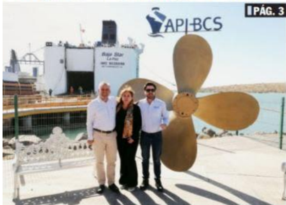
LA PAZ, BCS.- El gobernador michoacano, Alfredo Ramírez Bedolla busca consolidar el cabotaje marítimo desde el Puerto de Lázaro Cárdenas hacia otros estados del Pacífico mexicano.