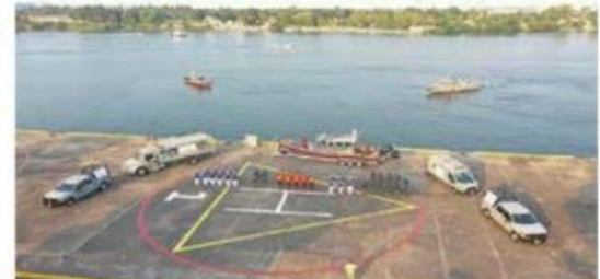
Desde ayer, la Armada puso en marcha la "Operación Salvavidas, Invierno 2022".