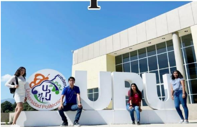
URUAPAN, MICH.- Gracias a gestiones realizadas por su Dirección General, la Universidad Politécnica de Uruapan recibirá 15 millones de pesos para ampliar su infraestructura y equipamiento; los primeros cinco millones ya se recibieron y comenzaron a aplicar.