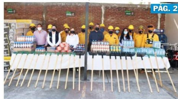
URUAPAN, MICH.- Apeam donó víveres y herramientas de trabajo para los brigadistas municipales que previenen y combaten incendios forestales.