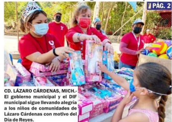
CD. LÁZARO CÁRDENAS, MICH.- El gobierno municipal y el DIF municipal sigue llevando alegría a los niños de comunidades de Lázaro Cárdenas con motivo del Día de Reyes.