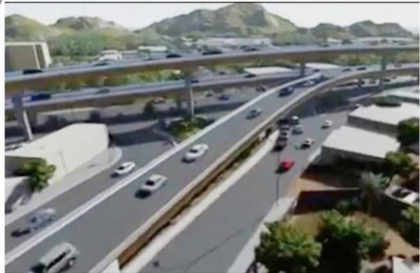
CD. LÁZARO CÁRDENAS, MICH.- Directivos de la Cámara Mexicana de la Industria de la Construcción piden prudencia entre actores del diferendo por el contrato del Distribuidor Vial para que se reanude la obra, que es trascendental para la modernización de la ciudad.

Aplicaron exitosamente 4,186 dosis de refuerzo a maestros