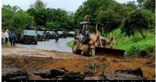
Fuerzas federales y estatales se encuentran rehabilitando los sitios donde fue cortada la carretera Coalcomán-Tepalcatepec, para garantizar el libre tránsito por esta vía.

En este operativo, las fuerzas armadas ➡ 4