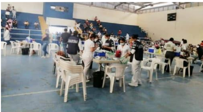
CD. LÁZARO CÁRDENAS, MICH.- 4 mil 186 trabajadores de la educación recibieron la dosis de refuerzo anti Covid en esta región.

Celebra DIF municipal Día de Reyes en comunidades