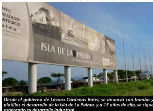
Desde el gobierno de Lázaro Cárdenas Batel, se anunció con bombo y platillos el desarrollo de la Isla de La Palma, y a 15 años de ello, se sigue esperando su desarrollo industrial.

Durante sábado y domingo, según el Consejo Estatal de Seguridad en Salud, en el municipio de Lázaro Cárdenas se registraron 34 y 33 nuevos casos po- ➡ 4