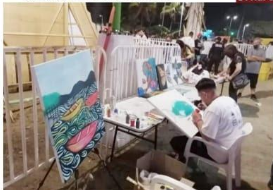
CD. LÁZARO CÁRDENAS, MICH.-El colectivo "Para Volar" tuvo una destacada participación en el vecino estado de Colima, durante el Carnaval de

Señalan que en 2021 se observó disminución delictiva en Tierra Caliente con respecto a 2020