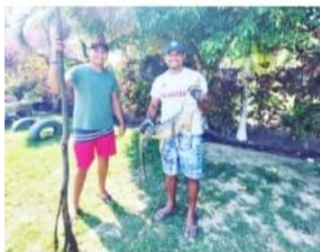
CD. LÁZARO CÁRDENAS, MICH.- Un cocodrilo que deambulaba en un salón de fiestas en la tenencia de El Habillal fue capturado por el Comité Vigilancia Ambiental Participativa "El Habillal".

Presentaron 15 obras de artistas urbanos de Lázaro Cárdenas