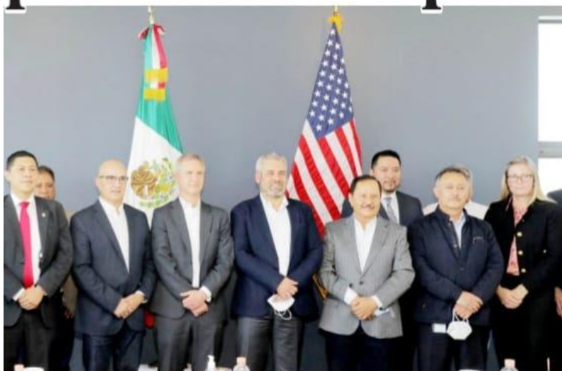
URUAPAN, MICH.- El gobernador, Alfredo Ramírez Bedolla, representantes de la Asociación de Productores y Empacadores Exportadores de Aguacate de México (Apeam) y de la USDA-Aphis se reunieron en la búsqueda de reactivar la exportación de aguacate michoacano a Estados Unidos.

Tendrán escoltas 90 empleados de la USDA PÁG. 4