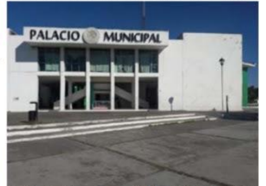
La ASF auditará los recursos que recibió el municipio de LC en el 2021, y que tienen que ver fondos federales para el fortalecimiento de los ayuntamientos.

Por la contingencia sanitaria en la actual cuarta oleada de COVID-19, la Sedena determinó suspender el tradicional festejo del 19 de febrero "Día del Ejército".