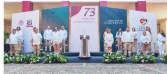
CD. LÁZARO CÁRDENAS, MICH.- Autoridades navales, militares y municipales conmemoraron este 16 de marzo, el 73° aniversario de la Instalación del Primer Ayuntamiento del municipio Melchor Ocampo del Balsas, hoy Lázaro Cárdenas.