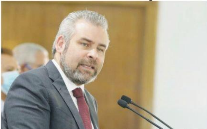
MORELIA, MICH.- Tras reconocer que la Ley para la Protección de Personas Defensoras de Derechos Humanos y Periodistas ha sido "letra muerta", el gobernador destacó que se trabaja para avanzar en su consolidación.