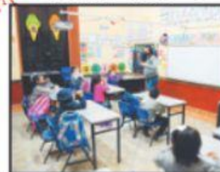
Hasta este año alumnos volvieron a las aulas.