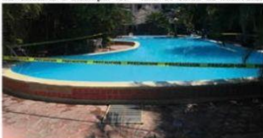
La Coepris, clausuró temporalmente la alberca de un hotel de LC, por incumplir las normas sanitarias.

Por detectarla fuera de normas sanitarias e incumplir los protocolos de salud, la Secretaría de Salud de Michoacán