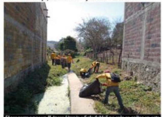
El programa por un "Lázaro Limpio y Saludable", no solo se aplica en este municipio, sino también que con la experiencia alcanzada, sus organizadores lo replicaron en el municipio de Tumbiscatío.