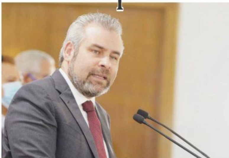
MORELIA, MICH.- Tras reconocer que la Ley para la Protección de Personas Defensoras de Derechos Humanos y Periodistas ha sido "letra muerta", el gobernador destacó que se trabaja para avanzar en su consolidación.