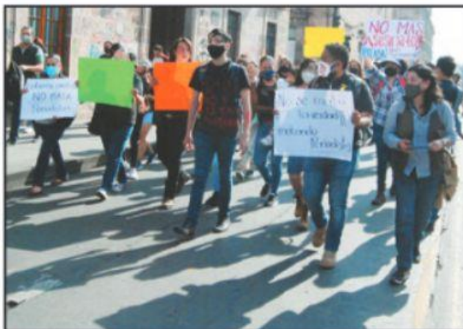
SON EL PERIODISMO LA VOZ DE MICHOACÁN