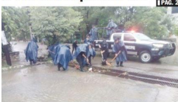
D. LÁZARO CÁRDENAS, MICH.- Este 15 de mayo dio inicio la temporada de ciclones