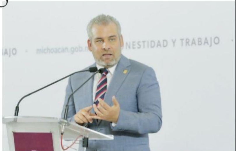
MORELIA, MICH.- El gobernador, Alfredo Ramírez Bedolla, afirmó que su administración seguirá trabajando con disciplina, orden y honestidad, en beneficio de las y los michoacanos.