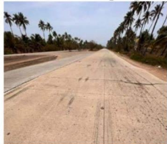
La delegada de turismo en LC, gestiona rehabilitación del boulevard playero.

Ante la importancia que reviste el boulevard playero para comunicar a Lázaro Cárdenas con la zona de playa, la delegada regional