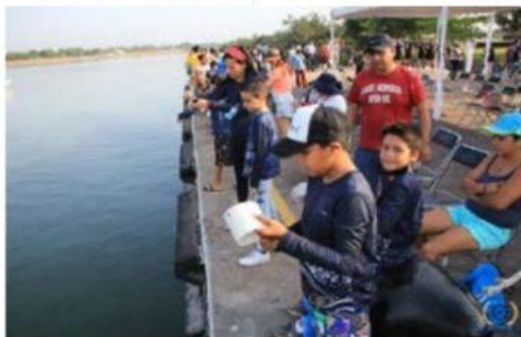
Cerca de 200 niñas y niños de 6 a 12 años de edad, participaron en torneo infantil de pesca 2022, organizado con motivo del Día de la Marina.

Con un ambiente familiar, se realizó el Torneo Infantil