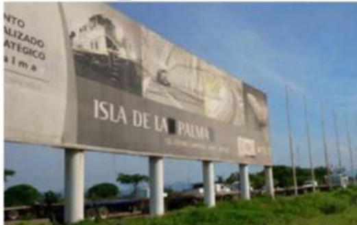
Aunque hasta ahora esto es lo más significativo que ha habido de la Isla de la Palma, la apuesta es firme para que en 30 meses más se desarrolle el Parque Logístico e Industrial más grande de Norteamérica, dice la Sedeco.

* En LC se proyecta el parque industrial más grande de Norteamérica: Sedeco.