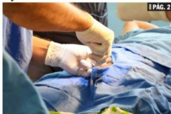
CD. LÁZARO CÁRDENAS, MICH.- La Jurisdicción Sanitaria No. 8 y el Hospital General Lázaro Cárdenas, están convocando a la población varonil de la región Sierra-Costa, a la Jornada Intensa de vasectomía sin bisturí que se está