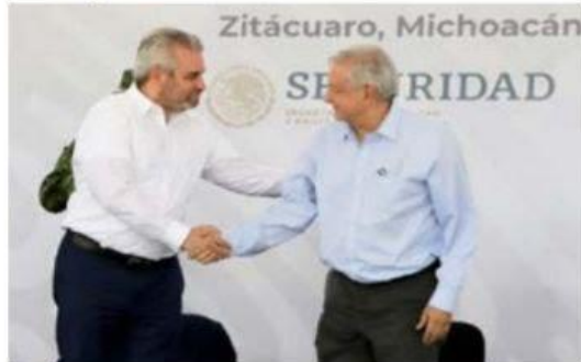
El gobernador Bedolla, señaló que asistirá a la marcha convocada por el presidente AMLO.

MERECES es un movimiento social que ha nacido por consecuencia de la alta siniestralidad 8