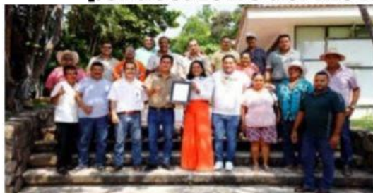
El comité de Desazolve y Enrocamiento del Río Acalpican, entregó un reconocimiento a la empresa ArcelorMittal, por el apoyo otorgado para esos trabajos.

El Comité de Desazolve y Enrocamiento del Río Acalpican entregó un reconocimiento a la empresa ArcelorMittal, por el apoyo otorgado para esos trabajos. 7