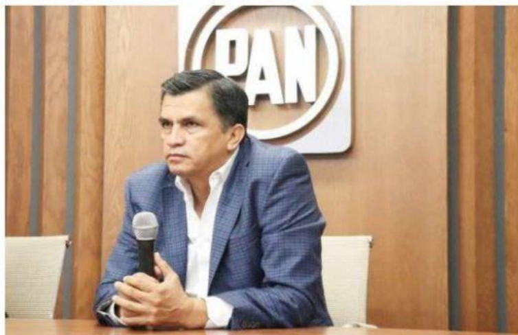
MORELIA, MICH.- Son tendenciosas las acusaciones contra 29 alcaldes, supuestamente vinculados con la delincuencia, dijo el secretario general del PAN, Javier Estrada Cárdenas.