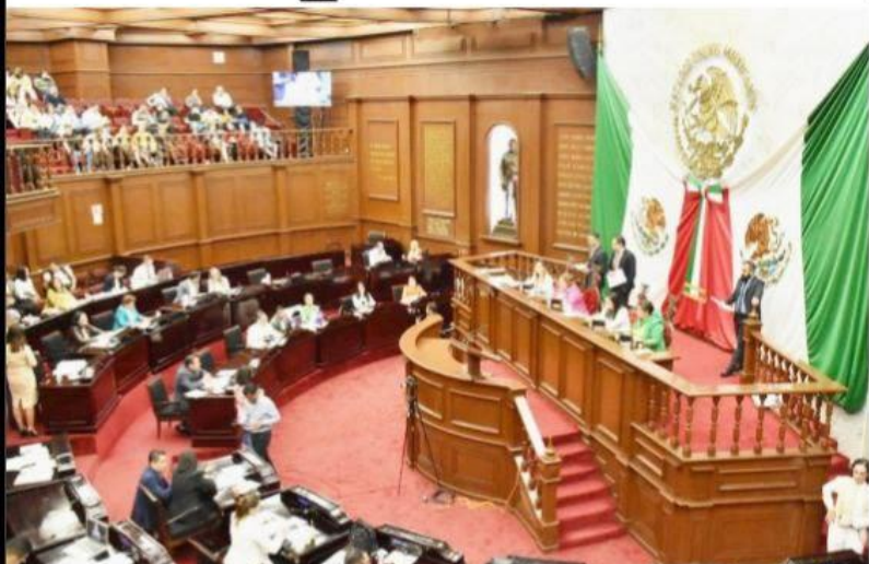
MORELIA, MICH.- Luego de un extenso análisis y de diversas reuniones al interior del Comité de Administración y Control de este Poder Legislativo, así como de la Junta de Coordinación Política (Jucopo) y de la Secretaría de Administración y Finanzas, se logró consensuar el monto.

■ Recursos que garantizan el correcto y óptimo ejercicio del Poder Legislativo PÁG. 2