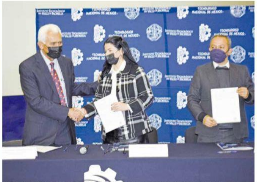
El Tecnológico Nacional de México y la Secretaría de Agricultura y Desarrollo Rural unen esfuerzos.

Colecta en pro del templo expiatorio de Puruándiro