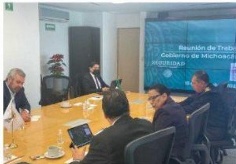
CIUDAD DE MÉXICO.- El gobernador expuso las condiciones y necesidades sociales de Michoacán para trabajar una ruta en común con el gobierno federal.

trabajo para dar seguimiento a los planteamientos y propuestas que permitan dar estabilidad y seguridad a las y los michoacanos, ya que coincidieron en la importancia de generar programas y proyectos de prevención y combate a la delincuencia, toda vez que dijeron que uno de los principales detonantes de la violencia es el consumo y la comercialización de narcóticos.