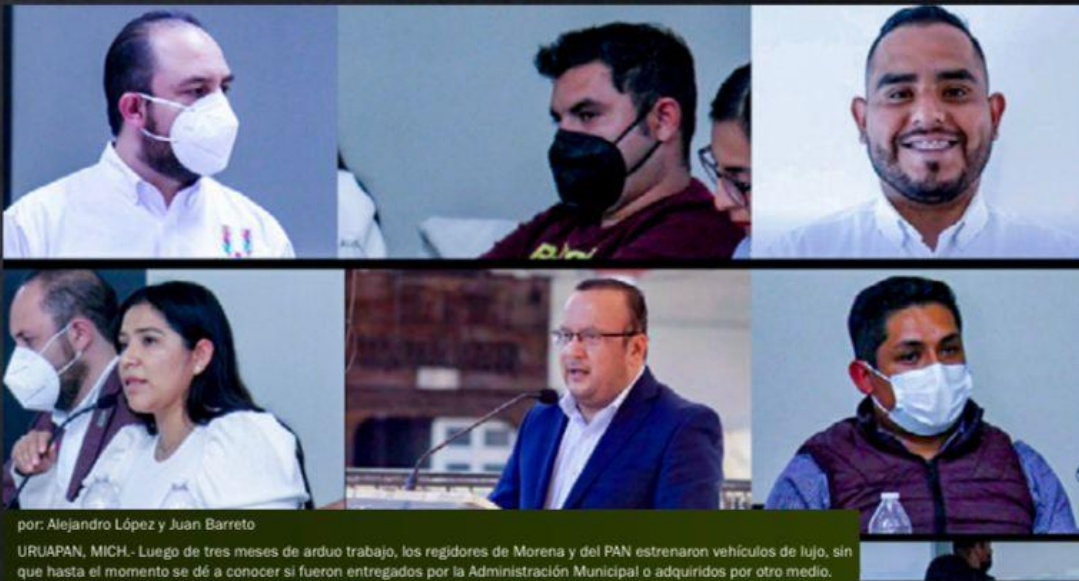
por: Alejandro López y Juan Barreto

URUAPAN, MICH.- Luego de tres meses de arduo trabajo, los regidores de Morena y el PAN estrenaron vehículos de lujo, sin que hasta el momento se dé a conocer si fueron entregados por la Administración Municipal o adquiridos por otro medio.