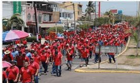
Este jueves por la tarde, los mineros de la 271 conocerán el resultado de las negociaciones de su comisión especial que acudió esta semana a la ciudad de México.

En la convocatoria respectiva, se dice que la asamblea será de carácter informativa, por lo que al parecer no habrá ninguna votación de alguna nueva propuesta que en la Ciudad de México le haya hecho llegar a la dirigencia nacional la empresa » 6