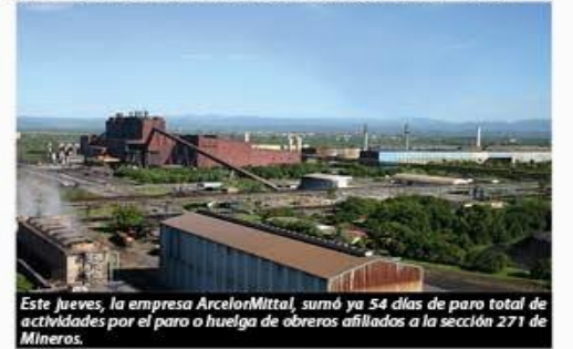
Este jueves, la empresa ArcelorMittal, sumó ya 54 días de paro total de actividades por el paro o huelga de obreros afiliados a la sección 271 de Mineros.

La coordinación del comité ejecutivo seccional 2023-2024, expresa toda su amarga experiencia con el actual gobierno estatal, y se pronuncia por aumento sa- » 4