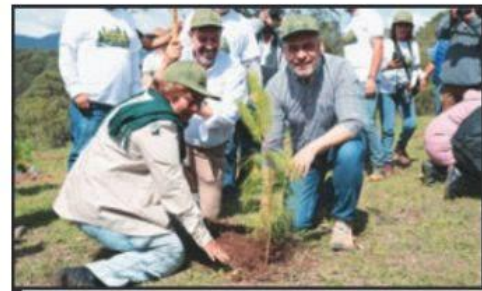
EN SAN JOSÉ DE LAS ALTAS TORRES, EN EL MUNICIPIO DE MORELIA, EL GOBERNADOR ALFREDO RAMÍREZ INICIÓ LA PLANTACIÓN.