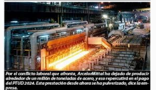
Por el conflicto laboral que afronta, ArcelorMittal ha dejado de producir alrededor de un millón de toneladas de acero, y eso repercutirá en el pago del PTUD 2024. Esta prestación desde ahora se ha pulverizado, dice la empresa.