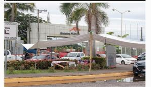
Directivos de empresas contratistas que prestan servicios de diversa índole a ArcelorMittal, piden la urgente intervención de los gobiernos estatal y federal, para que sirvan de mediadores y se resuelva pronto el conflicto minero.