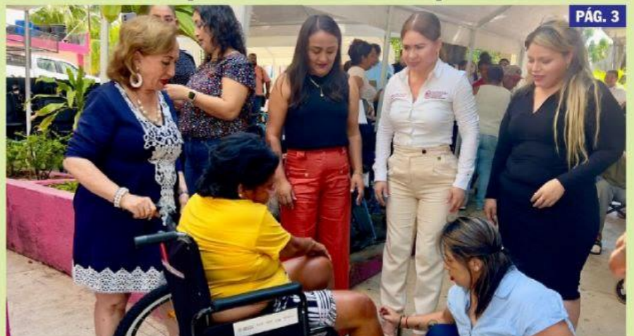
CD. LÁZARO CÁRDENAS MICH.- Mas de 80 personas con alguna discapacidad motriz resultaron beneficiadas con los aparatos que el DIF municipal y estatal entregaron ayer.