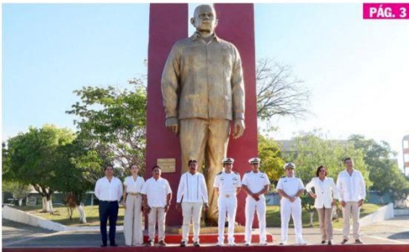
CD. LÁZARO CÁRDENAS, MICH.- Autoridades municipales, militares y navales conmemoraron el 86 aniversario de la Expropiación Petrolera.