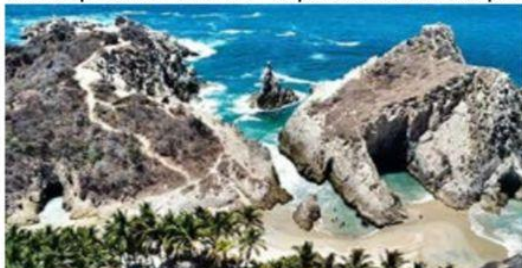
El "Dedo de Dios", uno de los atractivos turísticos de Maruata, municipio de Aquila.

Aquila, Mich., 18 de marzo de 2024.- Un boom adelantado de turismo de Semana Santa es el que se vive en el centro turístico de Maruata en la Costa de Aquila, donde más de dos mil turistas aprovecharon el puente de cuatro días para >>> 7