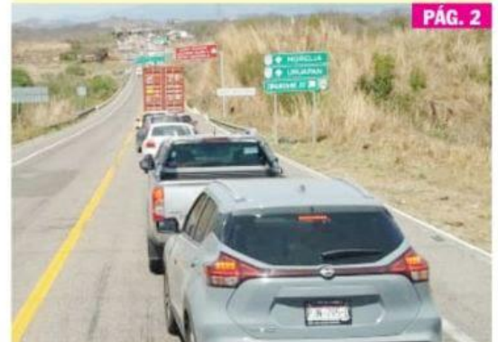
CD. LÁZARO CÁRDENAS, MICH.- Ayer lunes se registraron largas filas de vehículos en la autopista Siglo XXI, al concluir el fin de semana largo.