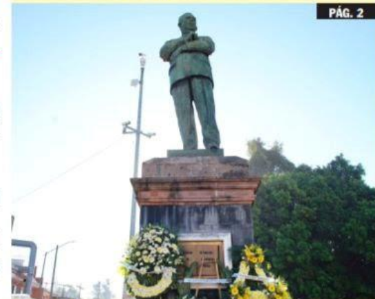
URUAPAN, MICH.- Autoridades municipales presidieron el acto cívico con que se conmemoró el 86 aniversario de la expropiación petrolera.