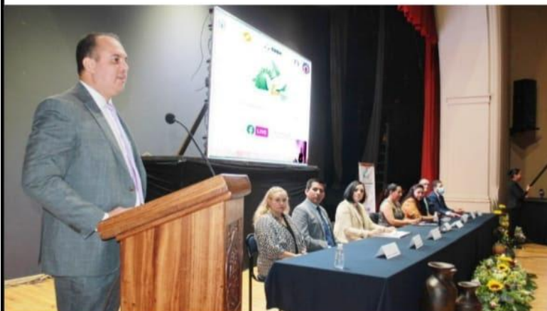
MORELIA, MICH.- Marco Antonio Tinoco Álvarez, ombudsman de la Comisión Estatal de Derechos Humanos reconoció que existen serios problemas en violación de derechos humanos en todo el estado.