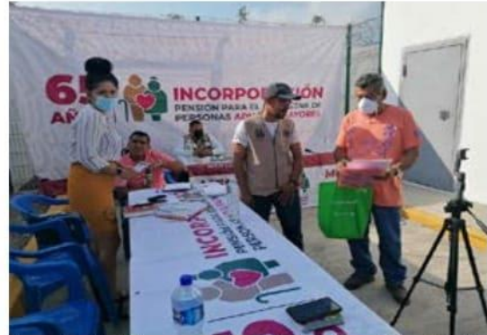
La pensión del adulto mayor es universal y de carácter social, no tiene distinciones, es para todos los que cumplan 65 años y más.

De fallecidos que siguen cobrando, adultos dados de alta y no subidos al sistema, cobro por otros que no es el beneficiario y alguna "incidencias" más, se calculan los 13 mil casos en Michoacán en el padrón del >>> 4