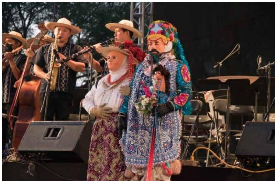
MAGNO CONCIERTO DE DOMINGO DE RAMOS en Huandacareo.