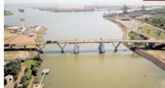
CD. LÁZARO CÁRDENAS, MICH.- El puerto michoacano está contemplado en cuatro rutas solo que la conexión Lázaro Cárdenas-San Juan de la Costa BC opera desde hace años para el acarreo de roca fosfórica que demanda l

■ Presumen en el Golfo rutas de cabotaje ya existentes en LC PÁG. 3