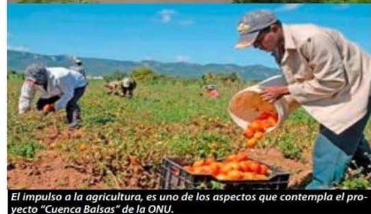
El impulso a la agricultura, es uno de los aspectos que contempla el proyecto "Cuenca Balsas" de la ONU.